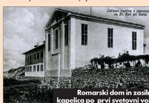
Romarski dom in zasilna kapelica po prvi svetovni vojni

“Začela kapucina s samostanom na Sv. Gori pri Gorici”