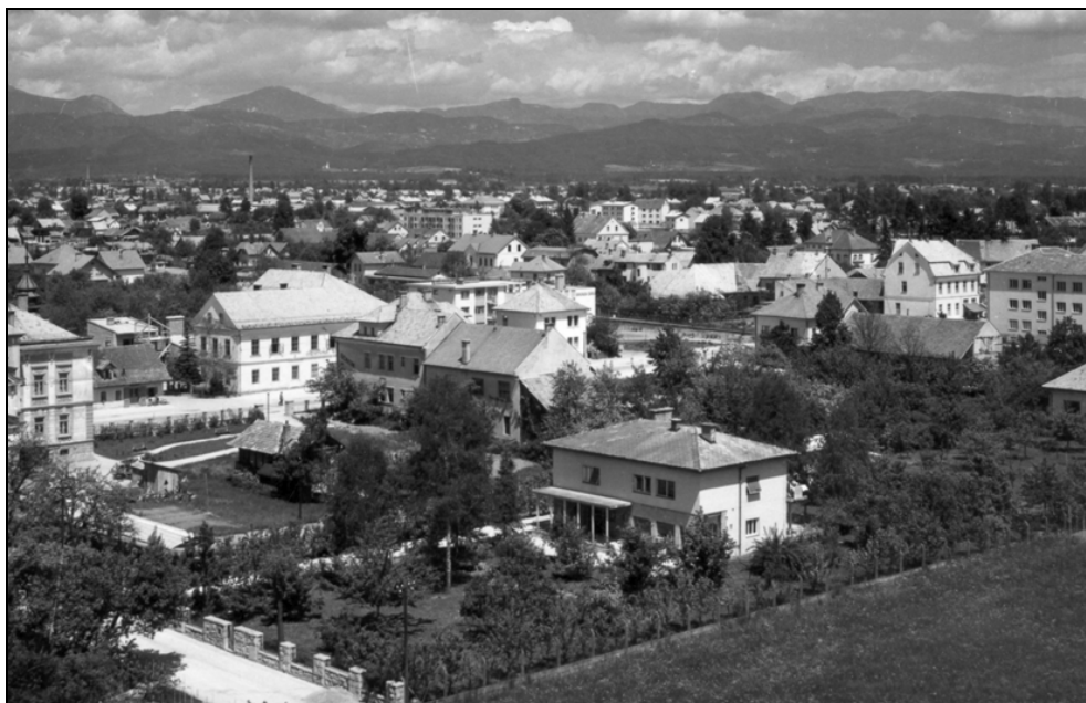
Domžale v petdesetih letih po razglasitvi za mesto.

trija. 71 Mestna občina je imela 9366 prebivalcev, od teh 47% delavskega, po 20% obrtnega in kmečkega prebivalstva, ostalih poklicev pa je bilo 13%. V mestni občini je bilo 21 industrijskih obratov kemične (5), usnjarske (2), prehrabene (6) in lesne (3) ter po eno papirne in strojne panoge. Po nacionalizaciji so se stara podjetja preimenovala. Med tovarnami, "ki so pomembne za gospodarstvo v republiškem oziroma zveznem merilu", so bile že pred vojno na jugoslovanskem in slovenskem tržišču uveljavljene Kemična tovarna, ki je nastala z združitvijo podjetij Medić-Zankl in Škrob-dekstrin, Tovarna kovičkov in usnjenih izdelkov TOKO, v kateri sta bili združeni Zornova in Okršlarjeva tovarna, ter Tovarna klobukov in slamnikov Universale, v Domžalah pa sta nastali še dve novi tovarni, Mlinostroj za izdelavo mlinskih strojev in Tovarna žganih pijač v nekdanji Kurzthalerjevi slamnikarski tovarni, Tovarna platnenih izdelkov Induplati v Jaršah, Tovarna papirja, kartona in lepenke ter Tovarna lakov in barv na Količevem ter Tovarna sanitetnega materiala TOSAMA na Viru, kjer sta se iz nekdanjih Majdičevih obratov razvila industrijski mlin in Tovarna olja. Druga industrijska podjetja so zadovoljevala lokalne potrebe. Kot izvoznik se je najbolj uveljavilo podjetje TOKO s 700 zaposlenimi, ki je prodajalo svoje izdelke v 15 držav. Glede na to je Domžalski vestnik za Domžale, "v Sloveniji najmlajše mesto, ki je bilo proglašeno po drugi svetovni vojni", poudaril, da jih smemo "šteti med mesta z