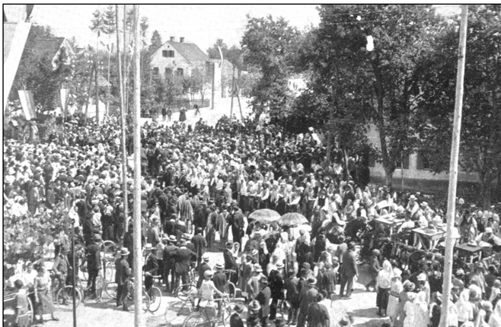
Slovesna razglasitev Domžal za trg 9. avgusta 1925.

in šolstva, ki mora poskrbeti za usposabljanje kvalificiranega delavstva, Domžale pa morajo dobiti tudi nove zdravstvene in socialne ustanove ter komunalne naprave. Pomembna takojšnja gospodarska posledica za Domžale pa je bila uvedba rednih tedenskih tržnih dni. 46