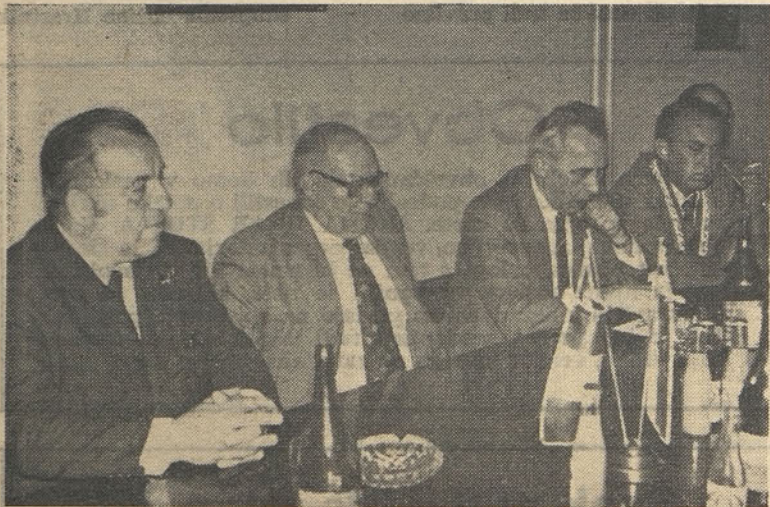
Župan pobratene francoske občine se na sestanku predstavnikov občine in družbenopolitičnih organizacij Hrastnika zahvaljuje za gostoljubnost, ki so jo čutili na vsakem koraku kamor so prišli