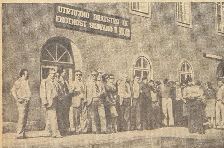
Veselo razpoloženi ob pesmi in kolu smo s prijatelji iz Raške pričakovali vlak »Bratstva in enotnosti«