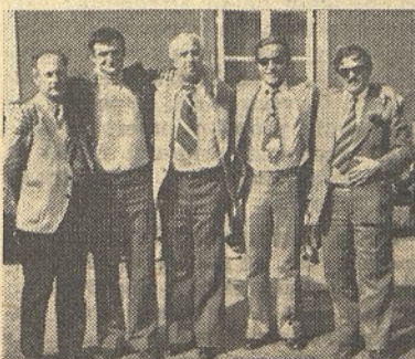
Pred odhodom vlaka še spominski posnetek

Do pobratenja naj pride v prihodnjem letu.