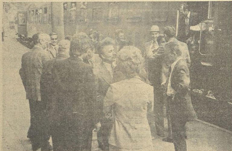
Gostje iz Raške izstopajo v Hrastniku iz vlaka »Bratstva in enotnosti«

Vozijo tudi danes po petintridesetih letih. Vozijo prijatelje, brate in sestre. Postali so vlaki bratstva in edinstva. Že nekaj let vozijo v spomin na tiste strašne noči in dneve. Njihova pesem je vesela, razposajena! Preveč je bilo gorja, da bi bila lahko dru-