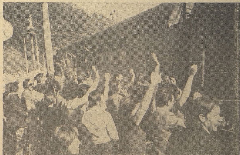
Takšno je bilo slovo od dragih prijateljev tik pred odhodom vlaka »Bratstva in enotnosti« na hrastniški železniški postaji