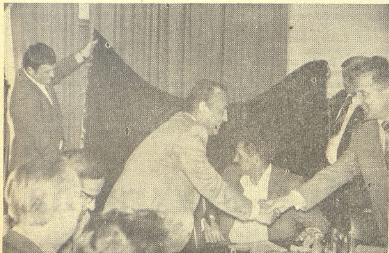
Predstavniki občine Raška so izročili darilo, stensko preprogo, katero je za to priliko izdelala starejša kmetica iz okolice Raške

— Priprave za sodelovanje na gospodarskem področju je skrb predsednikov obeh občinskih skupščin. Dolžna sta, da poiščeta