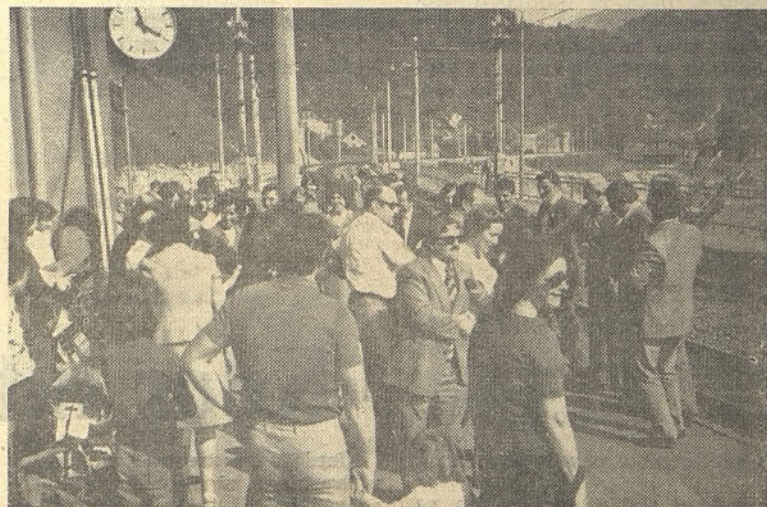
Na železniški postaji Hrastnik je bilo vzdušje enkratno

Hrastniku in Raški se zavežeta, da uredita vse potrebno za pobratenje omenjenih šol.