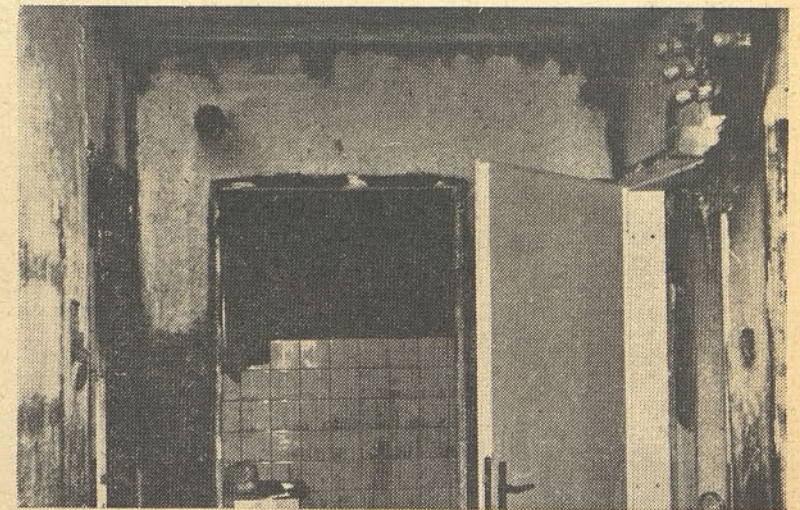
Tako je izgledalo stanovanje tovarišice Ane Poslek takoj po požaru, ki ji je uničil vse