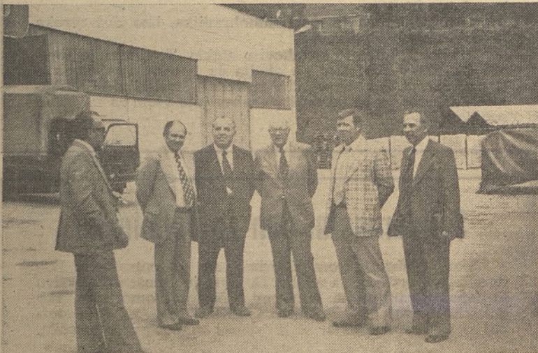
Delegacija pobratene francoske občine Montigny pred tovarno SIJAJ v Hrastniku