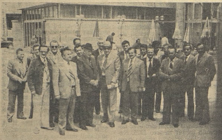
Predstavniki delegacije skupščine pobratene občine Raška ter predstavniki družbenopolitičnih organizacij in skupščine občine Hrastnik pred pričetkom skupnega sestanka

je dogajalo v njih, normalen človek le težko verjame. Človeško dostojanstvo je bilo povsem po-teptano. Pa vendar tudi to ni bilo dovolj. V očeh nacistov je obstajala samo ena rasa — arijska. Vse ostalo je bilo treba uničiti, poteptati, zbrisati s površine zemlje. Način ni bil važen. Vlaki pa so vozili. Vozili so na jug. Vse več slovenskih domov je prek noči ostajalo praznih. Iz njih je izginjala otroška razposajenost. Marsikateri prag ni nikdar več prestopila gospodarjeva noga. Slovence so selili. Cilj njihove selitve ni bil jasen nikomur. Postali so domačini prijaznih srbskih vasic, gostje še bolj prijaznih in gostoljubnih domačinov. S svojimi vsiljenimi domačini so delili kruh, streho in celo posteljo. V bedi, pomanjkanju, skup-