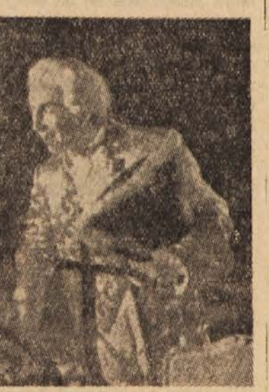
Gledališče za Slovensko Primorje je v letošnji sezoni naštvudilo 8 del in z njimi nastopilo v 33 dvoranah. Predstave si je ogledalo 30.000 ljudi ali vsak 6 prebivalce Primorske. Med drugim so igrali tudi tragedijo »Kovarstvo in ljubezen«.

ki je zavarovan kot kulturni spomenik, lastnik pa je Fizikultura zveza Slovenije. Šeškovo dom naj bi prevzel OLO ali LO MO Kočevje, ki naj bi ga tudi vzdrževal iz proračuna. Vse sekcije so bile delavne; dramska je imela 16 predstav, od teh štiri premiere. Večkrat je nastopila tudi lutkovna sekcija; le-ta pa ima v načrtu, da bo priredila prihodnji mesec več nastopov. V okviru »Svobode« deluje tudi Ljudska univerza. Društvo je februarja organiziralo ideološko-politični tečaj, ki ga obiskuje 30 ljudi; to je pa za Kočevje vsekakor premalo. Najdelavnejša sekcija v »Svobodje« je pevška, ki ima moški, ženski in mešani pevski zbor. Razveseljivo je tudi, da v društvu deluje baletna sekcija, v katero je vključenih več kot 20 pionirjev in pionirk. Iz razprave na občnem zboru je bilo razbrati, da je nujno zbrati Rudniško »Svobodo« iz Salke vasi s »Svobodo« Kočevje-mesto; ob skupnem sodelovanju bi bili uspehi lahko boljše. Obe društvi sta le četrte ure oddaljeni drugo od drugega, zato bi bilo sodelovanje D.V.