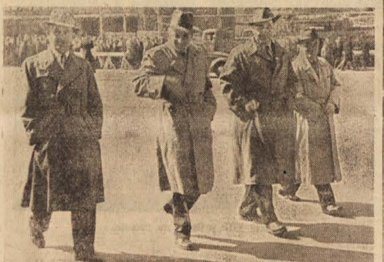
Člani plenuma na poti v zgradbo CK ZKJ

Na koncu leta 1952 je bilo 770.654, na koncu leta 1953 pa — poudarjam na koncu leta 1953 — brez na novo sprejetih številčno stanje 700.050 članov ZK. Imamo torej razliko 70.604. Po naši statistiki se je število za toliko zmanjšalo, če pa upoštevamo