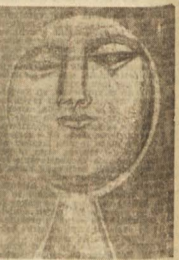
Lazar Vozarević: Portret žene

V klubu Zdrženja književnikov v Beogradu razstavlja Lazar Vozarević serijo svojih risb. Kritika je ugodna sprejela razstavljenega dela.