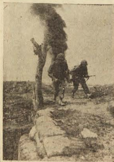
Boji za Dien Bien Fu: francoska vojska se prebijata pod ognjem Giapove artilerije

ljajo na drugi del vietminškega napada, ki je pred dnevi po hudi tridnevni bitki nekoliko popustil.