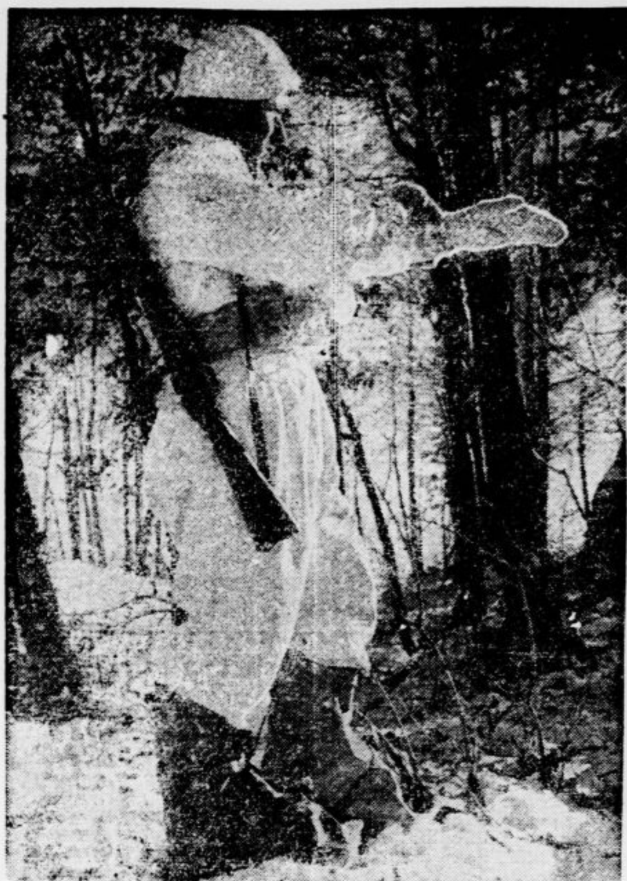
Oddečki italijanskih alpincev v obleki bele zaščitne barve na vzhodni fronti: straža v sprednjem položaju