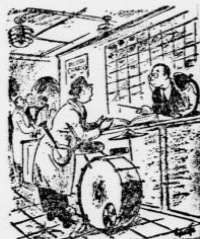
»Rad bi mično, tiho sobo!«