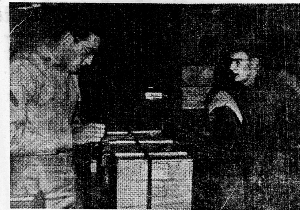
Takoj po objavi sporazuma o Svobodnem tržaskem ozemlju med Italijo in Jugoslavijo so se britanske in ameriške čete v Trstu pritele pripravljati za odhod. Prva kolona avtomobilov ameriške vojske je že v petek zjutraj zapustila Trst. Na proski postaji pri Trstu pa že natovarjajo 50 vagonov z ameriškim vojaškim materialom. S te postaje bo danes odpotoval tudi prvi vlak ameriških vojakov. Na sliki: Ameriški vojski se pripravljajo za odhod.