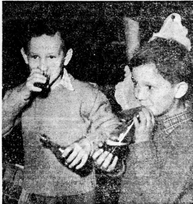
Kraljevo, 9. okt. Danes je v Kraljevo prispela belgijska sindikalna delegacija, ki se mudi že več dni v naši državi. Člani delegacije so obiskali okrajni sindikalni svet, kjer so se zanimali za delo sindikalnih organizacij, za njihove uspehe in izkušnje. S posebnim zanimanjem so poslušali obrazložitev o delavskem samoupravljanju v naši državi. Obiskali so tudi največje delovne kolektive, tovarno vagonov in »Mahnogrom«.

stovili napredek naše industrije in razvoj v drugih državah. Končno so se udeleženci posvetovanja zavzeli za to, da zdravju škodljivega alkoholizma obvezno tudi brezalkoholne pijače.