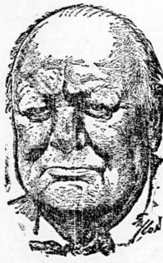
Govoreč nato o londonski konferenci, je Churchill pohvalil vodjo britanskega zunanega ministrstva Edena in izrazil prepričanje, da bo sporazum, sklenjen na tej konferenci, ogledni kamen na poti k mirnemu sožitju. Tako imenovane konvencionalne vojaške sile Atlantskega pakta so mnogo manjše kot sovjetske sile, zato se je Rusom ni treba bati, da jih bo kdo napadel.

Rusi menjajo nafto za Hmone in pomaranče. Sovjetska zveza je nedavno predlagala Izraelu razširitev obstoječega kompenzacijskega sporazuma o prodaji surove nafte in nakupu limon ter pomaranč. Lani je Izrael izvozil v Sovjetsko zvezo okoli 600.000 zabojev limon v zameno za 100.000 ton surove nafte.