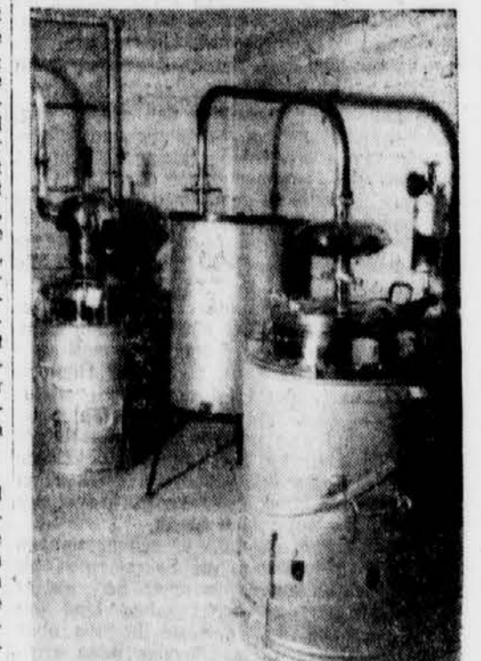
Destillationsapparate in vorbildlicher Arbeit

m. Sonntagsdienst der Behörden am 2. Jänner. Der Reichsminister des Innern hat bestimmt, daß zur Einsparung von Kohle bei den staatlichen Behörden, den Gemeinden, Gemeindeverbänden und sonstigen Körperschaften, Anstalten und Stiftungen des öffentlichen Rechts der Dienst am 2. Jänner 1943 wie an den Sonntagen zu regeln ist, es sei denn, daß die Kriegswihnachten eine andere Dienstregelung erfordern.