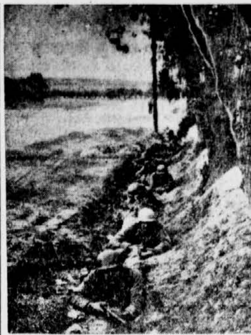
PK-Kriegsbericht Büschgens (PBZ) (sch)