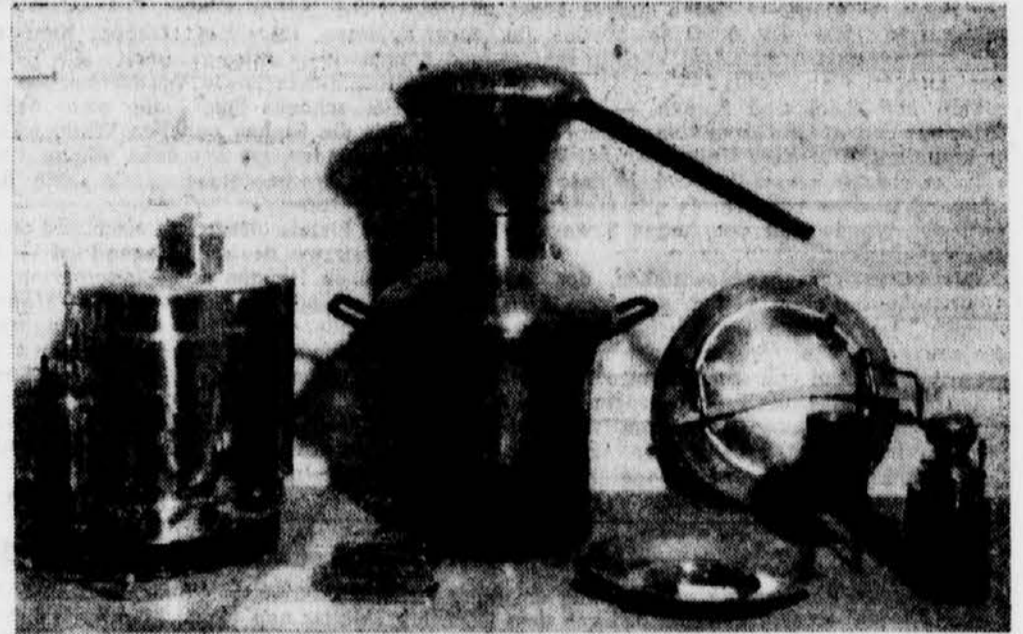
Kupferschmiede zeigen, was sie können

schers Menschen. Hier kommen Schaffensfreude und schöpferische Kraft zum Ausdruck, wie sie nur deutschen Menschen zu eigen sind. Das ist ein Beweis mehr, daß Sprache und andere Außerlichkeiten nur Tüchle sind, während sich der Deutsche in seiner schöpferischen Tätigkeit, die nur blutbedingt ist, nicht verleugnen kann. H. E.