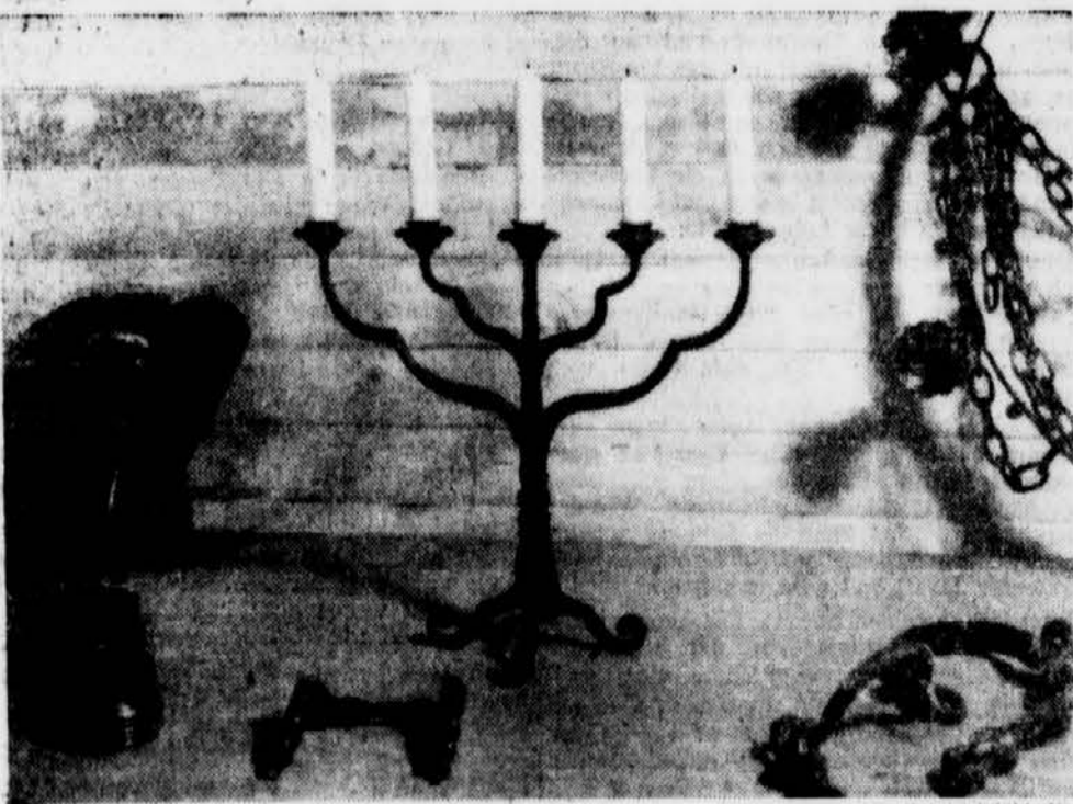
Schöne schmiedeeiserne Schmuckstücke auf der Handwerker Ausstellung