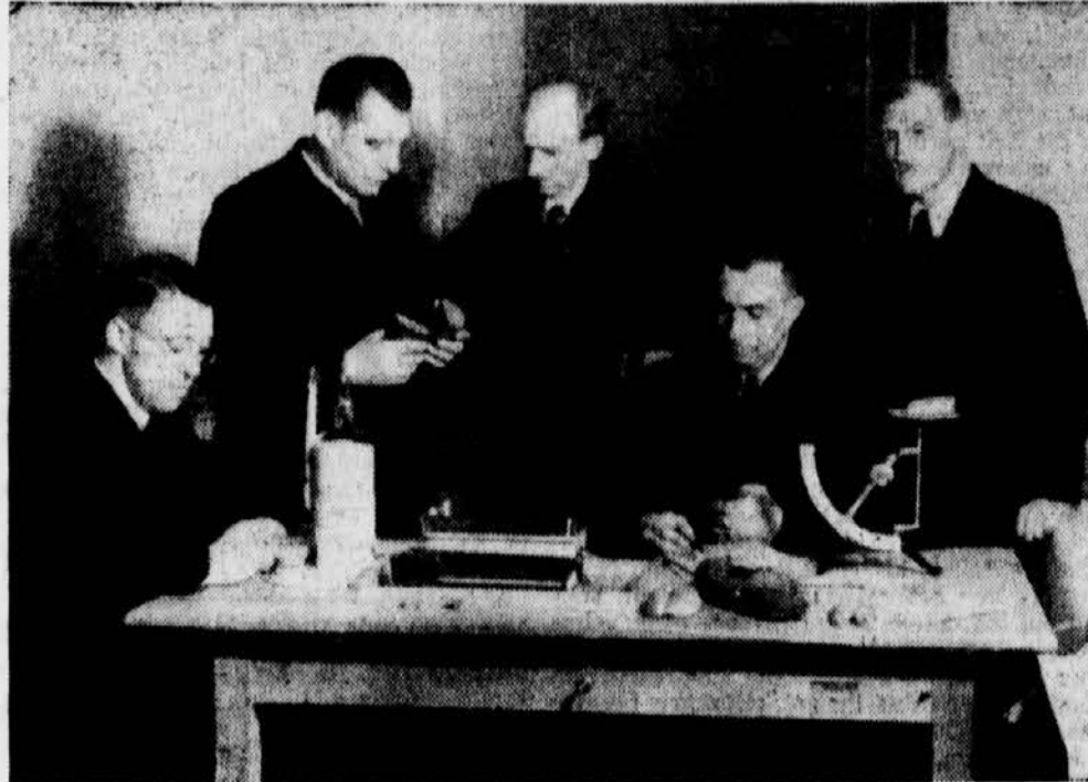
Prüfungskommission für Brotbewertung in Marburg-Stadt waltet anlässlich des Handwerkerwettkampfes ihres Amtes

Die Erzeugnisse der untersteirischen Meister sind stolze Zeugen des Könnens deut-