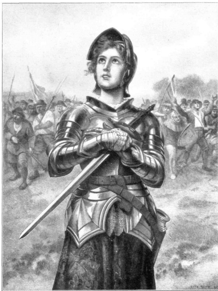
SV. DEVICA ORLEANSKA ZAŠČITNICA SLOVENSКИH ORLIC