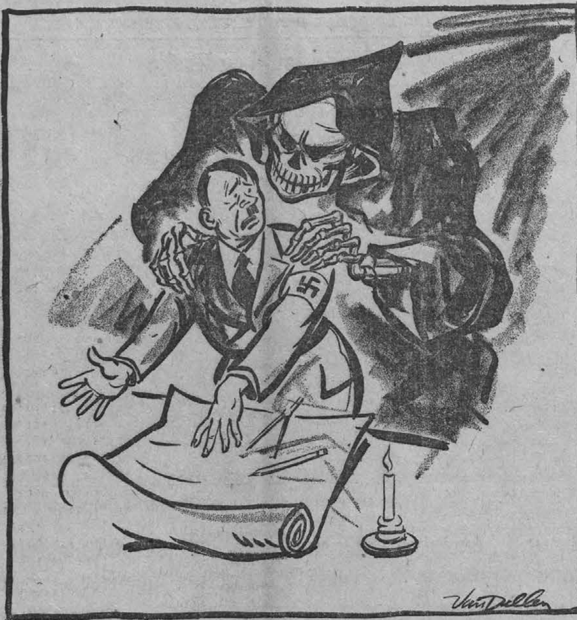
Hitler je poslal Smrt v Rusijo, slednja pa prihaja zdaj nazaj k nemški armadi in nemškemu ljudstvu. Hitlerjeve obljube, da bo zdaj vse prav, ko je on prevzel poveljstvo nad nemškimi armadami, so prazne.