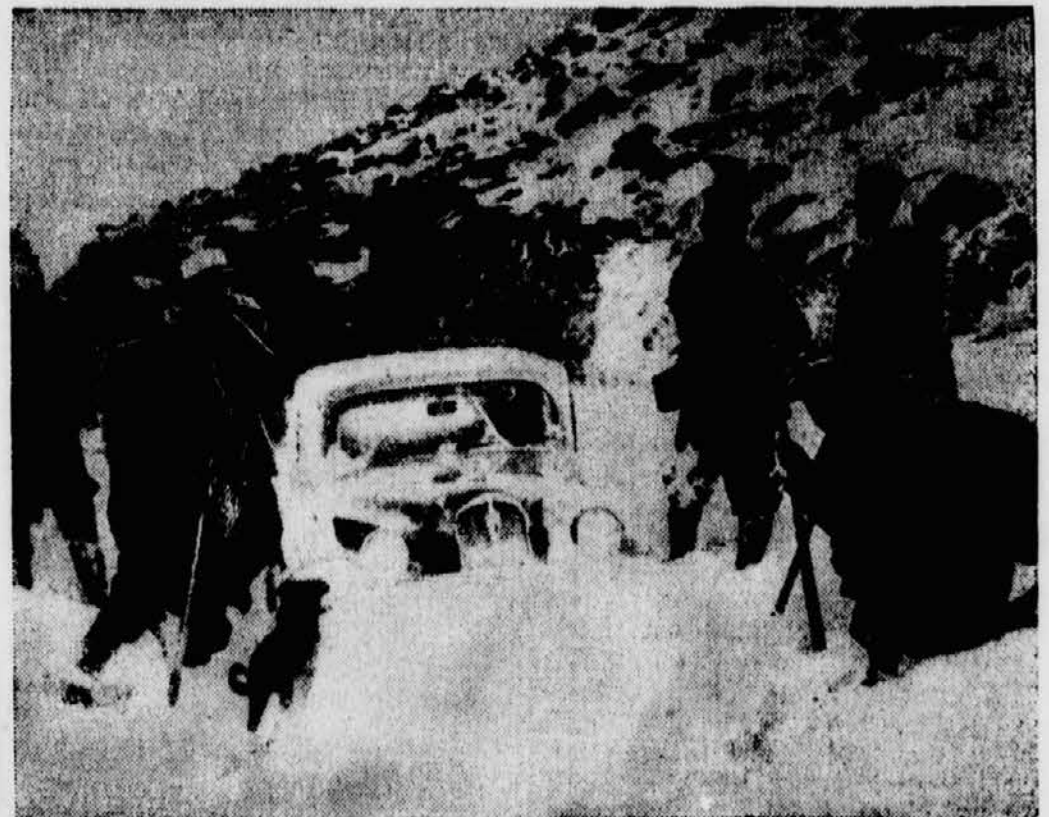
Ganz Marokko und vor allem das Atlasgebirge wurde in den letzten Tagen von schweren Schneestürmen heimgesucht. Die Schneeverwehungen waren so stark, daß der Verkehr auf den Gebirgsstraßen vollständig lahmgelegt wurde. Unser Bild zeigt Touristen beim Ausgraben eines eingeschneiten Autos auf einer Bergstraße des Atlas.