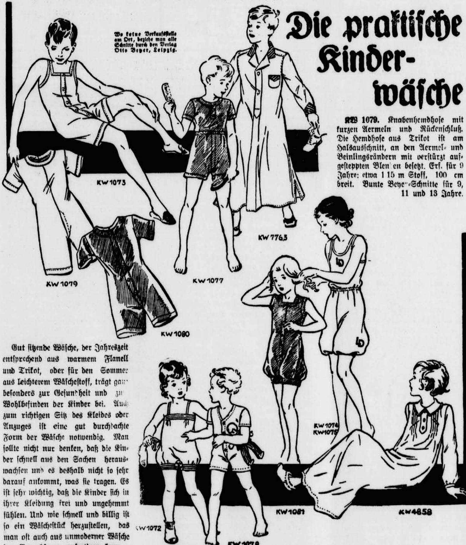
Wo keine Verkaufsstelle am Ort, bestelle man alle Schnitte durch den Verlag Otto Beyer, Leipzig.

RB 4858. Dieses Mädchennachthemd kann man aus Varchent oder Flanell arbeiten. Den Kragen herabent eine schmale Spitze. Erf. für 5 Jahre: etwa 1.80 m Stoff, 80 cm breit. Bunte Beyer-Schnitte für 1, 3, 5, 7, 9, 11, 13 Jahre.