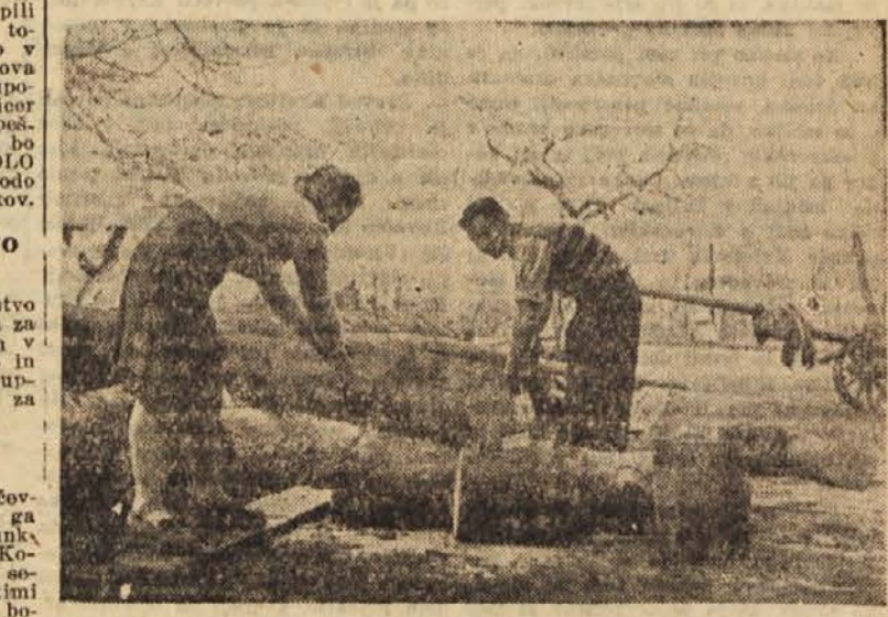
Hilite, da bi bila drvarnica kmalu polna

V Ljutomeremskem okraju so se začele gospodarsko nadaljevalne šole. Okrog 2000 mladincev in mladink se je do sedaj prijavilo v te tečajne. V križevcih pri Ljutomeru je začel delovati tudi angleški tečaj, ob koncu prejšnjega meseca pa šoferski.