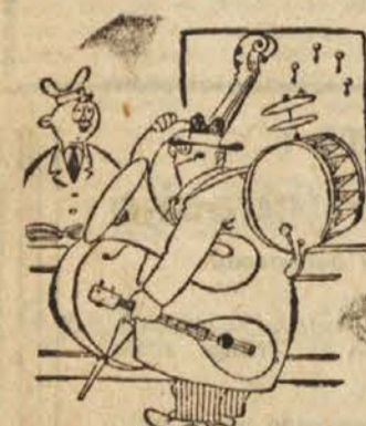
»Rad bi imel zelo mirno, tiho sobo.«