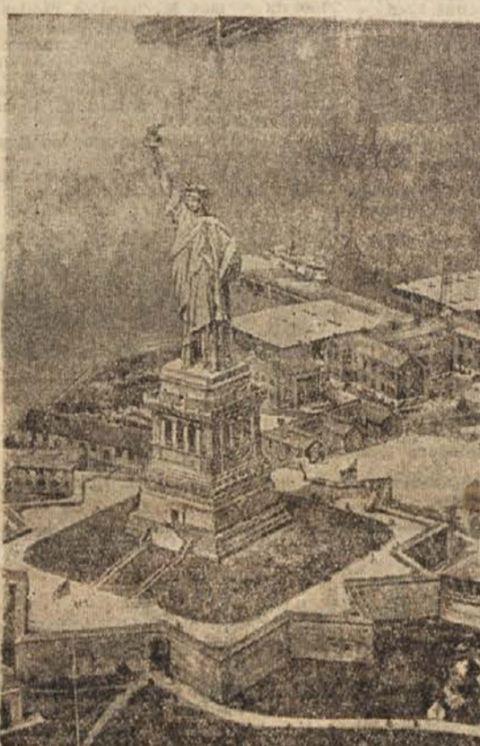
Kip Svobode v newyorškem pristanišču

Masivno poslopje s štirinaj kolum podobnimi stolpi nasproti kipu Svobode so mnogi stanovalci