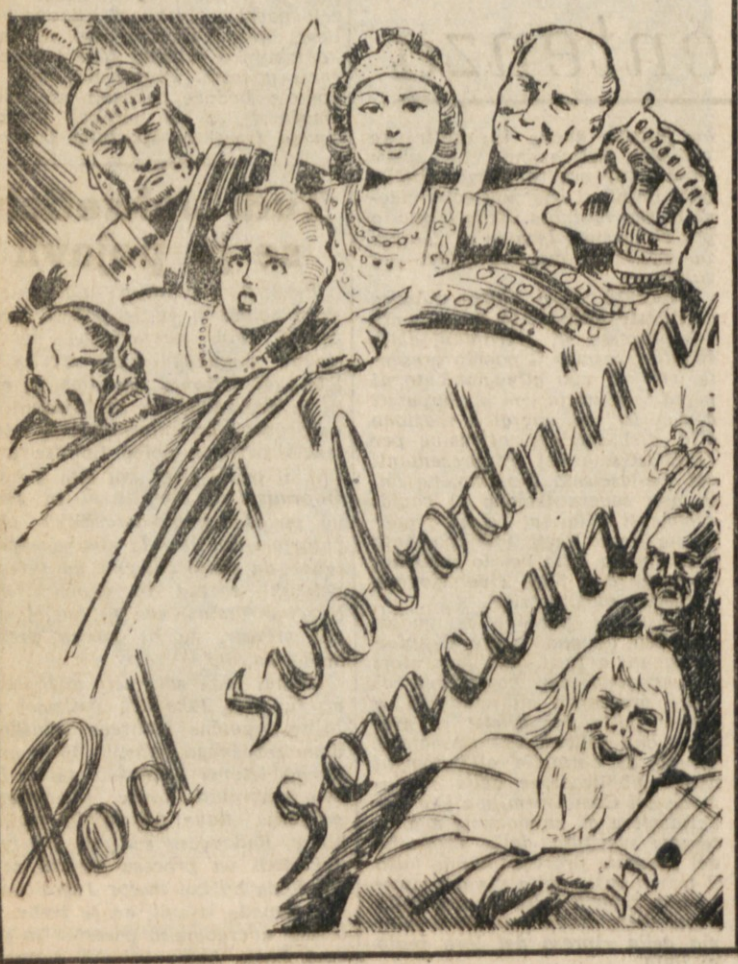
Pod svobodnim soncem