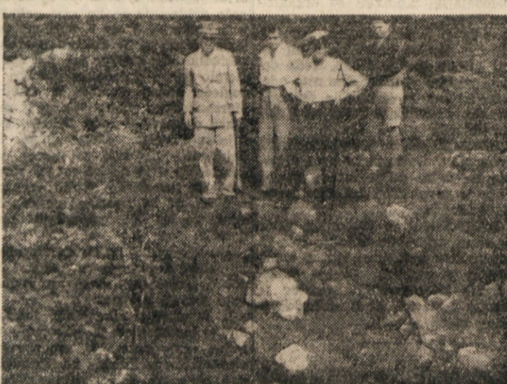
MESTO, KJER JE LEZALO TRUPLJO. ODDALJENO JE KOMAJ NEKAJ STO METROV OD DOMA.

Vzroki, ki so privedli zločina do tega koraka, so še neznani. Nesrečno mati s sestro pokojnice, kateri smo obiskali na domu, sta nam užalošni pripovedovali o tem lepeu.