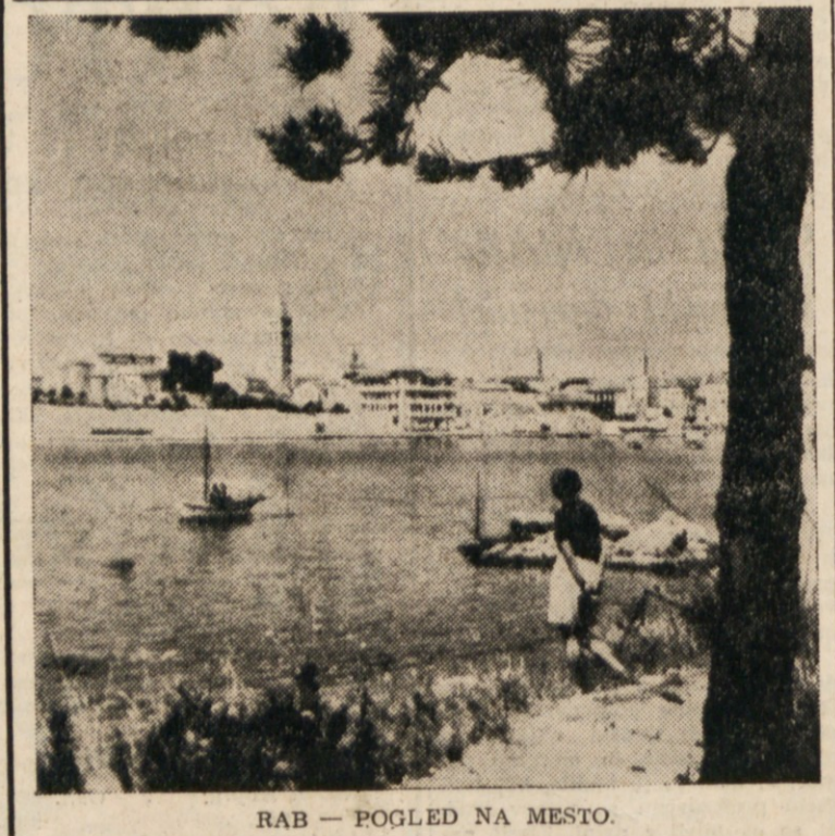
RAB — POGLED NA MESTO.

Barka drsi komaj silšno po vodni gladini. Mrak lega skrivnostno na zemljo in na morje. Nič sledu ni več, da se je nedolgo poprej postopilo sonce vanj. (Nadaljevanje sledi)