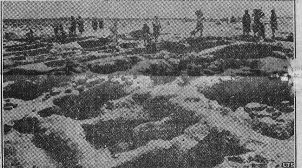
Ob Rdečem morju so izkopali obridje nekdanjega Salomonovega pristanišča. Izkopnine vodi Ameriška šola orientalskih raziskovanj, pod vodstvom Nelson Gluecka.