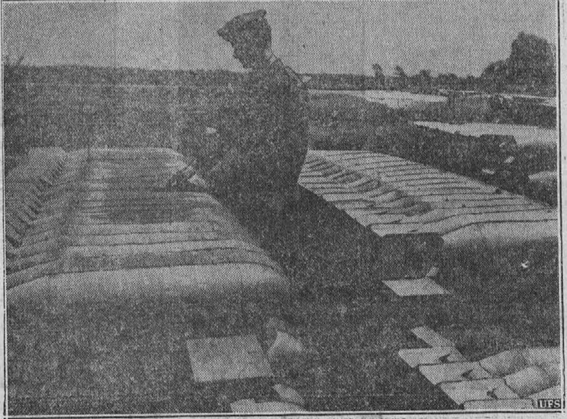
To so bombe strica Sama, ki so pripravljene za napadalne zrakoplove. Stric Sam se mrzlično oborožuje, ko vidi, da je ves svet tako nervozen.