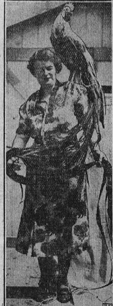
Petelin yokohama pasme, ki ima izredno lep rep. Ti petelini imajo do 20 čevljev dolg rep in so doma na Koreji.