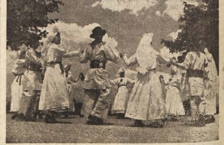
Belokranjska folklorna skupina (iz filma »Pomlad v Beli krajini«)

res ni mnogo! Toda dalje! Kmet-pijač, sestavljena ob zaključku šolskega leta na šolskih ustanovah črnomeljskega okraja, nam je dala nekaj zanimivih, hkrati pa poraznih ugotovitev. Oglejmo si jih! Naše osnovne šole in gimnazije obiskuje 3200 učencev. Izmed teh ne uživa alkoholnih pi-