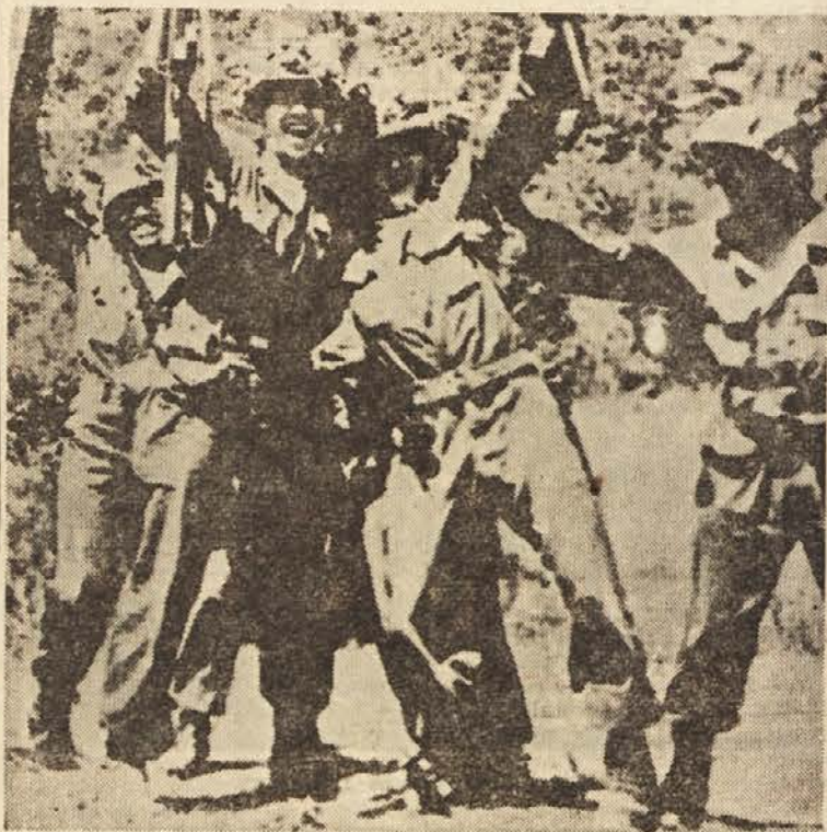
Vojski na Koreji so se doslej že nekajkrat veselili ob vesti, da bo kmalu podpisano premirje...

Poveljnik oboroženih sil Združenih narodov general Marc Clark je izdelal načrt za rešitev problema, ki je nastal zaradi zahtev južnokorejskega predsednika Sing Man Rija, naj se ne bi indijske čete in druge enote, določene za nadzorstvo nad ujetniki, izkrcale v Južni Koreji. Iz poučenih virov se je zvedelo, da je Clark predlagal, naj bi te enote prišle v stik z vojnimi ujetniki šele po podpisu premirja. Tako bodo lahko