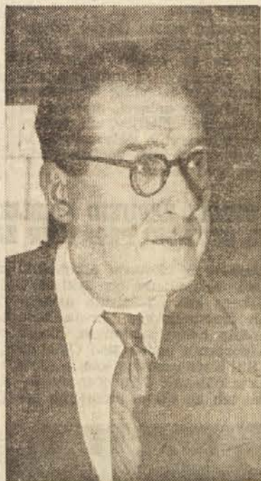
Dirigent Krešimir Baranović