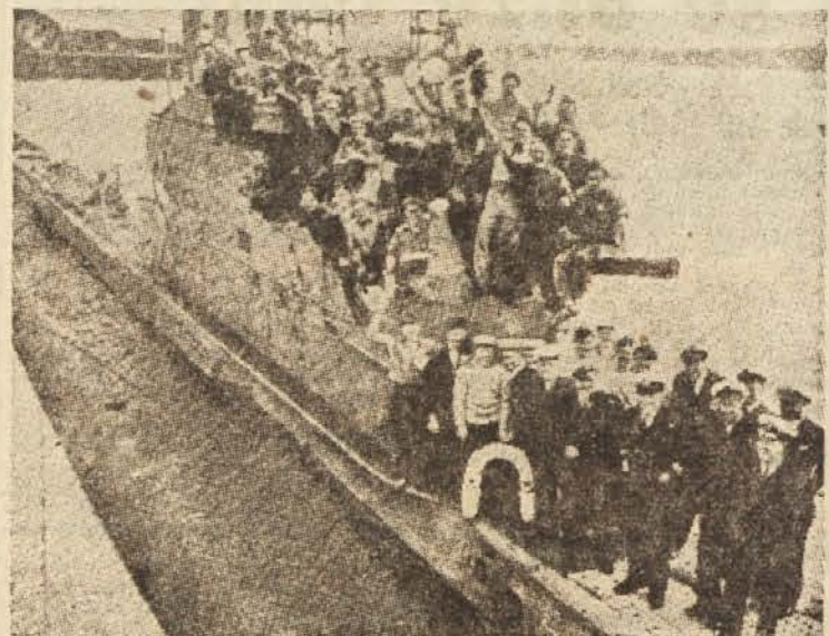
V sredo smo poročali o velikem uspehu angleške podmornice »Andrews«, ki je prevozila 5520 km dolgo pot čez Atlantski ocean pod vodo. Na sliki vidimo zagotovljeno podmornico z njeno posadko.

Mnogi narodi so poznali uporabo preprostega lesenega pluga za obdelovanje zemlje, čeprav so bili na zelo nizki stopnji. Edini narod, ki pluga ni poznal, je bil v srednjem delu Amerike živeči Majja. Zanimivo je, da je imel ta narod slikovno abecedo, da je poznal številke in ni bilo njihove uporabe, da je dosegel znatne uspehe v astronomiji in da je imel zelo razvito aritmetiko. Koruzo pa je sejal v jamice, ki so jih delali v zemljo s palčami. Pluga in oranja Majja sploh niso poznali. Zato so svoja zemljišča često zapuščali in šli iskati novo rodovitno zemljo. S tako primitivnim obdelovanjem so zemljo kmalu izpraznili in ker je niso znali preorati, jim ni več rodila.