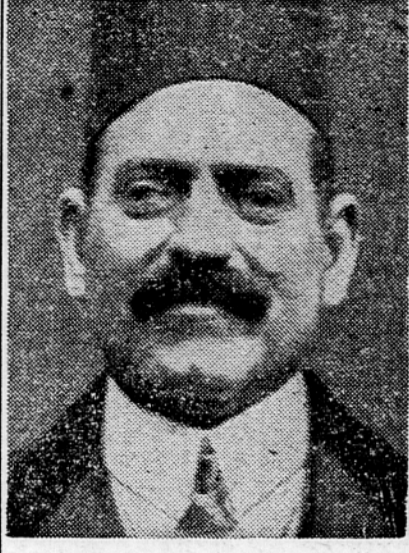
Egipt je čisto očital Veliki Britaniji, da je število njenih čet večje kakor določba pogodbe. V obveščilih krogeh trdijo, da ima Britanija sedaj na področju Sueškega prekopa približno 40.000 vojakov.

Egiptovska vlada je že takoj po drugi svetovni vojni zahtevala od britanske vlade, naj umakne svoje čete s področja Sueškega prekopa, kjer ima Velika Britanija letalska in pomorska opoistiša. Po pogodbi ima Britanija pravico držati 10.000 vojakov, toda