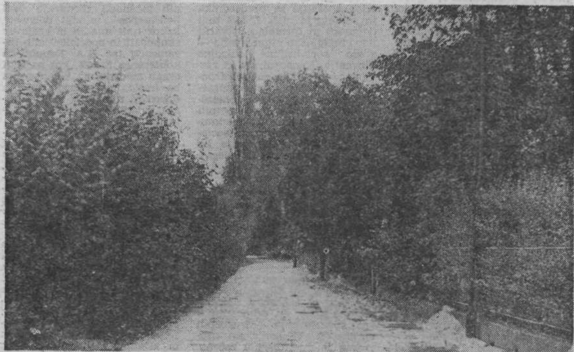
Po tej sedaj odmaknjeni uličici na robu Tivolija naj bi v prihodnje potekala prometna tripasovna cesta

Inž. Vedam: »Dokler ni jasna koncepta, ne moremo de-