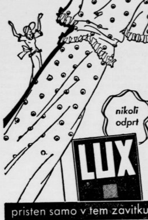
pristen samo v tem zavitku

Sirote so izgubile zdaj še mater, ki je v duševni zmedenosti povzročila, da so ostali tudi brez strehe.