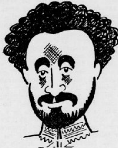
K Italijansko-abesinskemu sporu: Haile Selasie, edini domači cesar na črnem kontinentu