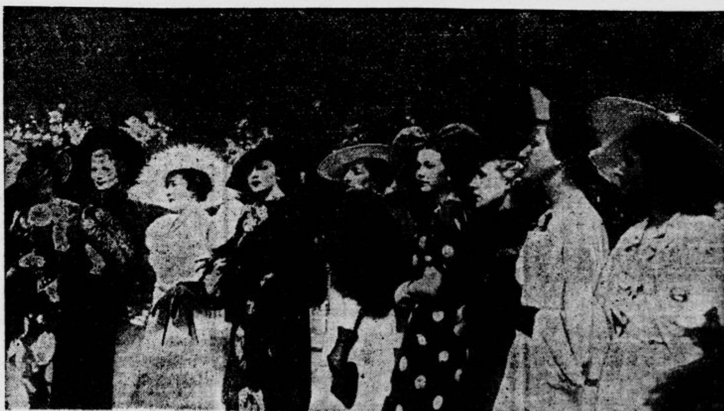
so napravili, kar se razume samo ob sebi, v Parizu, kjer so tudi privedili tekmo najlepših ženskih pokrival. Na sliki vidimo skupino tekmovalk, ki zaslužijo resnično priznanje za svoj okus