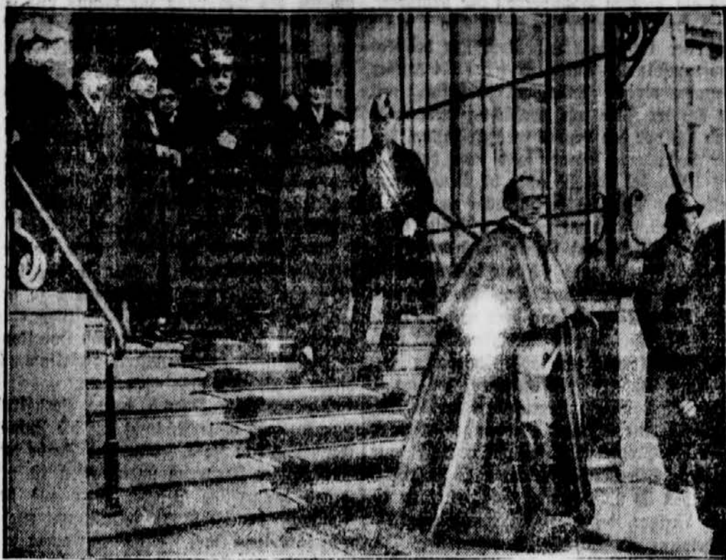
Das Berliner Diplomatische Korps, an der Spitze der päpstliche Nuntius P a c e l l i, verläßt nach dem Empfang das Präsidentspalais. Auf der Treppe ganz links