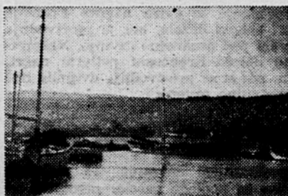
Zalji pri Izolj

V vasi Truške v Koperskem okraju so prišli ljudje z zastavami na zborovanje. Mnogo je bilo med njimi žena, ki so se živahno razgovarjale o tem, da bi bilo treba ustanoviti zadruge za mlečne izdelke. In ker je tod okoli mnogo paradiznikov, so mnenja, da bi se ustanovila tovarna za konzerviranje. V Koštaboni so se prav žene zelo zanimale za večerne tečaje in so navdušene zanje. Mnogo žena se je že kar na isti večer pripravilo za tak tečaj in vse so vpisale tudi svoj otroke. Zene so zahtevale: »Se mene vpišite, se mene! Jaz ne znam pisati! Jaz ne znam čitati! Jaz pa sploh v šoli nisem bila!« Ko so zvedele, da jim bodo pri teh tečajih pomagale tudi žene iz Slovenije in vse Jugoslavije, predvsem z zvezi in svincniki, so bile še bolj navdušene. V Gažonu je zborovanje zelo lepo uspelo. Ko so govorili o »Tedinu istrske žene«, klesal pomen