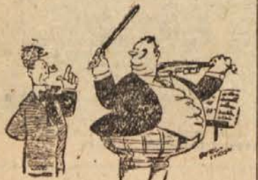
»Drži gosli pod brado.« »Pod katero?«

Oče je sledil svojim sinovom v zapore in pozneje pripovedoval, kako junaško so se držali. Zlasti starejša dva sta izpričala veliko junaštvo, ko sta hotela prevzeti nase vso krivdo, da bi rešila mlajše brate smrti. Neke noči pa so partizani ubili nekega fašističnega kolovodjo in vseh sedem Cervijevih sinov je fašistična tolpa odgnala na morišče in ustrelila. Padli so kot talci.