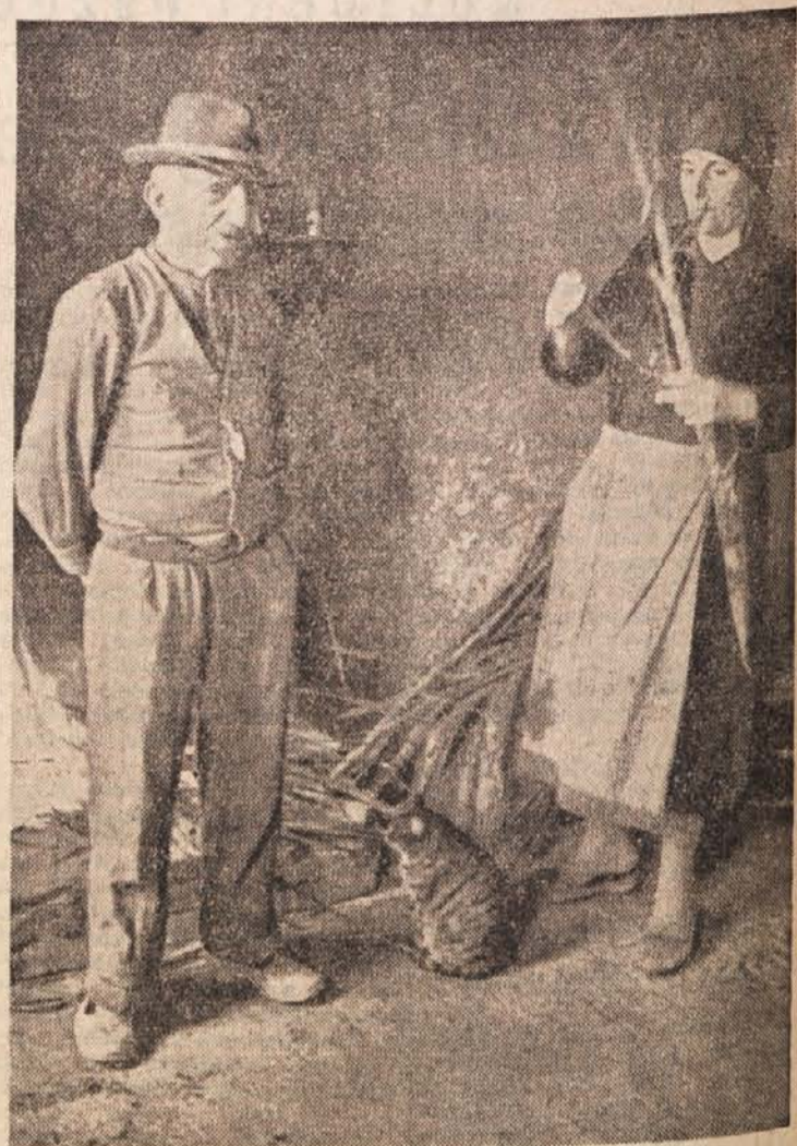
Starši ustreljenih sinov Cervi

V Cuibi v Braziliji so imeli nedavno hude nalive. Deroča voda je sprostila kepice zlata in jih prinesla v bližino središča tega mesteca. Kepico zlata, težko 54 gr, so razstavili v neki izložbi. Neki reporter je našel kepico zlata na vrtu svoje hiše. Menda se še nikoli ni zgodilo, da bi voda naplavila v mesto zlato.