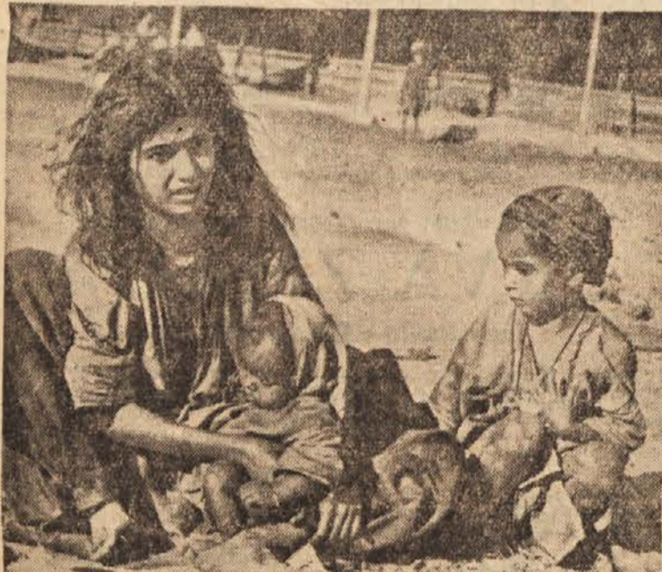
Indijska mati z otrokoma počiva ob cesti

da milijonom primanjkuje živil, murveč ponekod niti pitne vode nimajo.