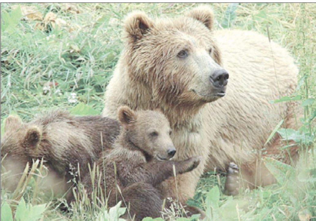
Obisk medvedk z mladiči pri ljudeh v tem letnem času ni tako nenavaden