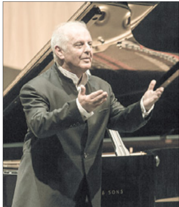
Dirigent Daniel Barenboim je nastopil kot pianist

Christoph Eschenbach je z napeto gesto, lucidno vodil veliko zasedbo Simfoničnega orkestra NDR. Izbira Zimmermannove skladbe je bila uvod v enega od glavnih dogodkov opernega programa festivala, saj bodo v ponedeljek (20. avgusta) uprizorili njegovo opero Die Soldaten v režiji Alvisa Hermanisa in pod vodstvom Inga MetzmacHERJA, ki bo po napovedih sladokuscev eden od vrhuncev letošnjega festivala in je tudi koprodukcija z milansko Scalo. Opera po libretu Goethejevega sodobnika Jakoba Lenza je bila redko izvedena zaradi izjemnih pevskih zahtev partiture, zanimivi glasbeni zasnovi pa bo uprizoritev dodala še vizualne elemente, zaradi katerih se bo še izraziteje vtis-