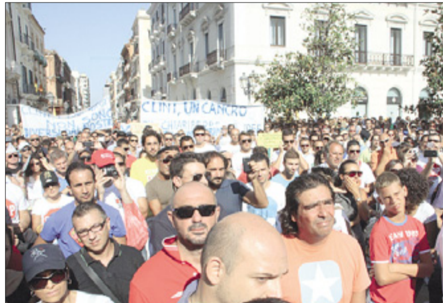
Udeleženci demonstracij so zahetvali zdravje in delo

nizacije Legambiente. Protestna povorka pa ni mogla do središča mesta, ki ga je stražilo približno 400 pripadnikov varnostnih sil.