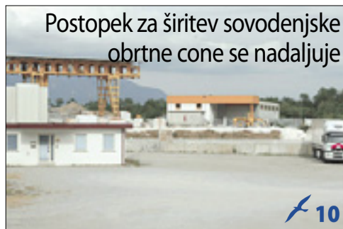
Postopek za širitev sovođenjske obrtne cone se nadaljuje