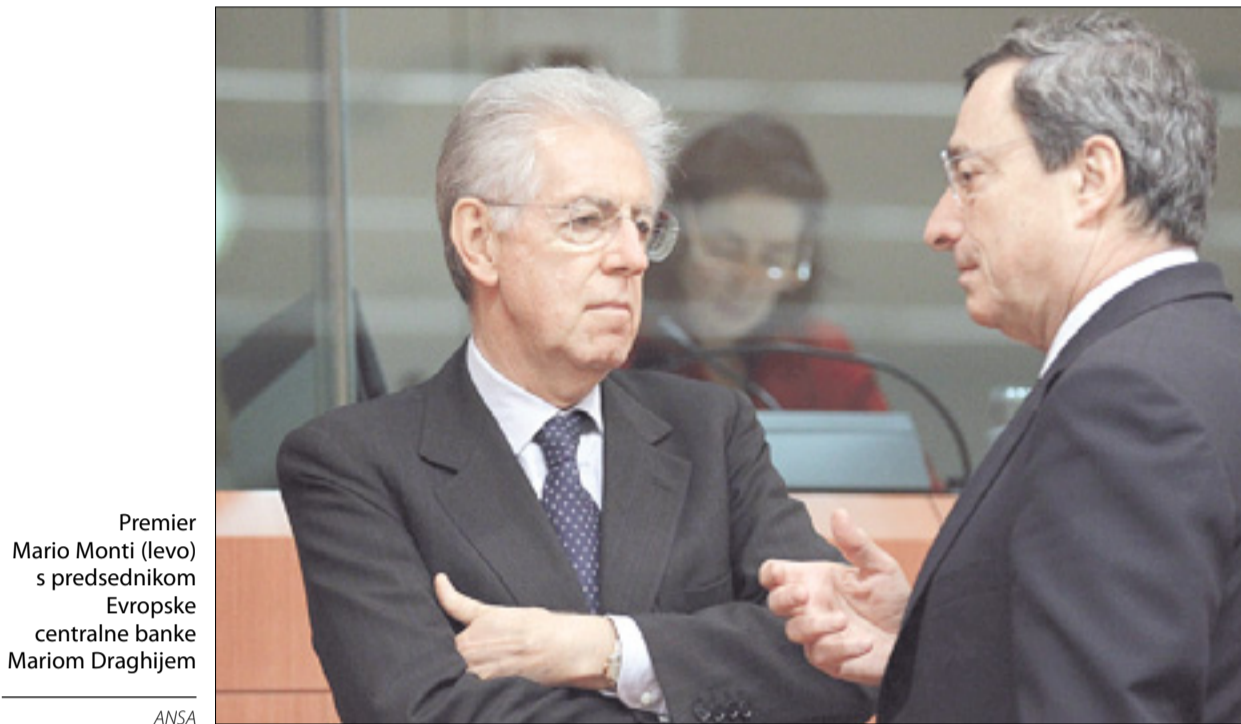
Premier Mario Monti (levo) s predsednikom Evropske centralne banke Mariom Draghijem

Dotaknil se je tudi sodstva in napovedal številne novosti, glede telefonskih prisluškovanj pa je dejal, da je prišlo in še prihaja do številnih zlorab. Kar zadeva šolstvo, pa je zagotovil, da bo vlada ustrezna sredstva namenila tudi šolam, ki »ob javnem šolstvu zagotavljajo pomembno komplementarno izobraževanje«. Dejaj, da bo vlada pri tem upoštevala omejitve, ki jih predvidevajo ukrepi o zmanjšanju javne porabe, vse pa bo določeno z jenskim zakonom o stabilnosti.