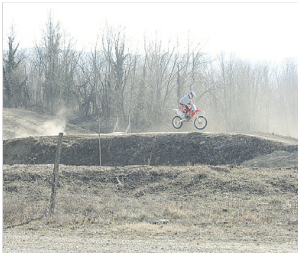
Lokacija v Vrtojbi, kjer bo centralna čistilna naprava; sedaj je tam proga za motokros

Občine prijavljajo projekt centralnega odlagališča odpadkov v Stari Gori in čistilne naprave v Vrtojbi