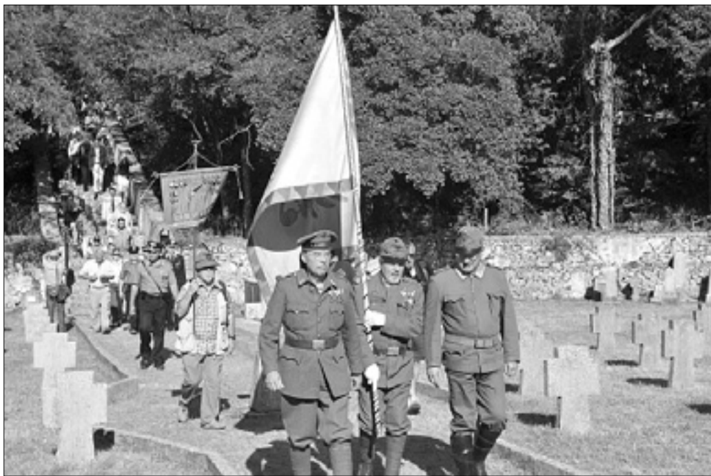
Včerajšnja prireditve na Proseku so odprli Avstrijci v vojaških uniformah iz prve svetovne vojne