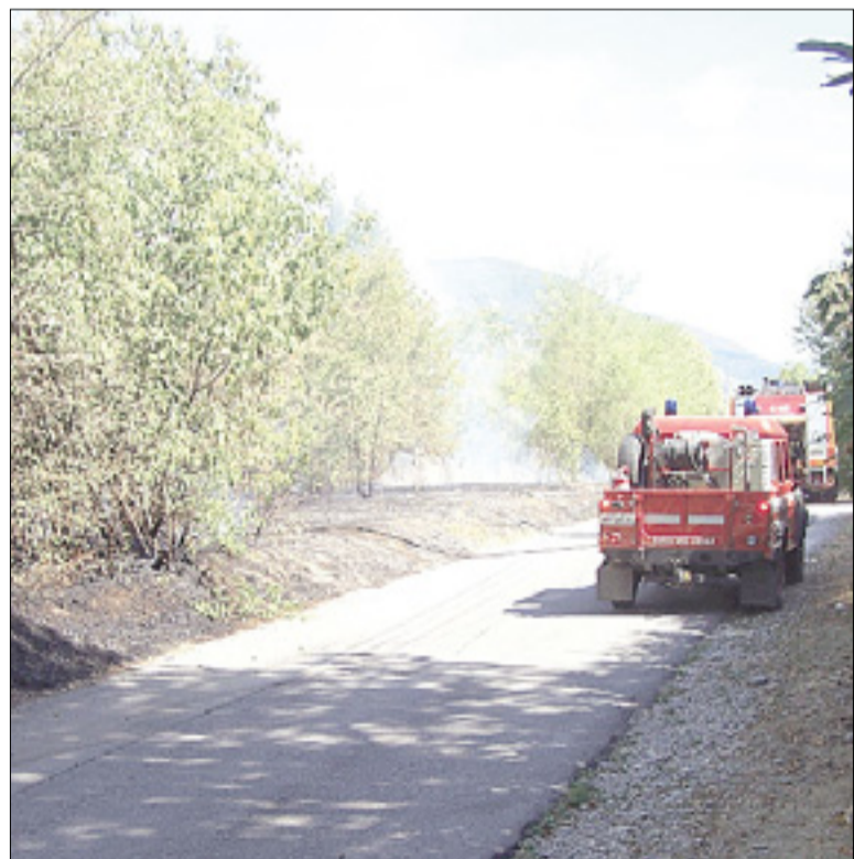
Gasilci na delu v Ulici Scogli