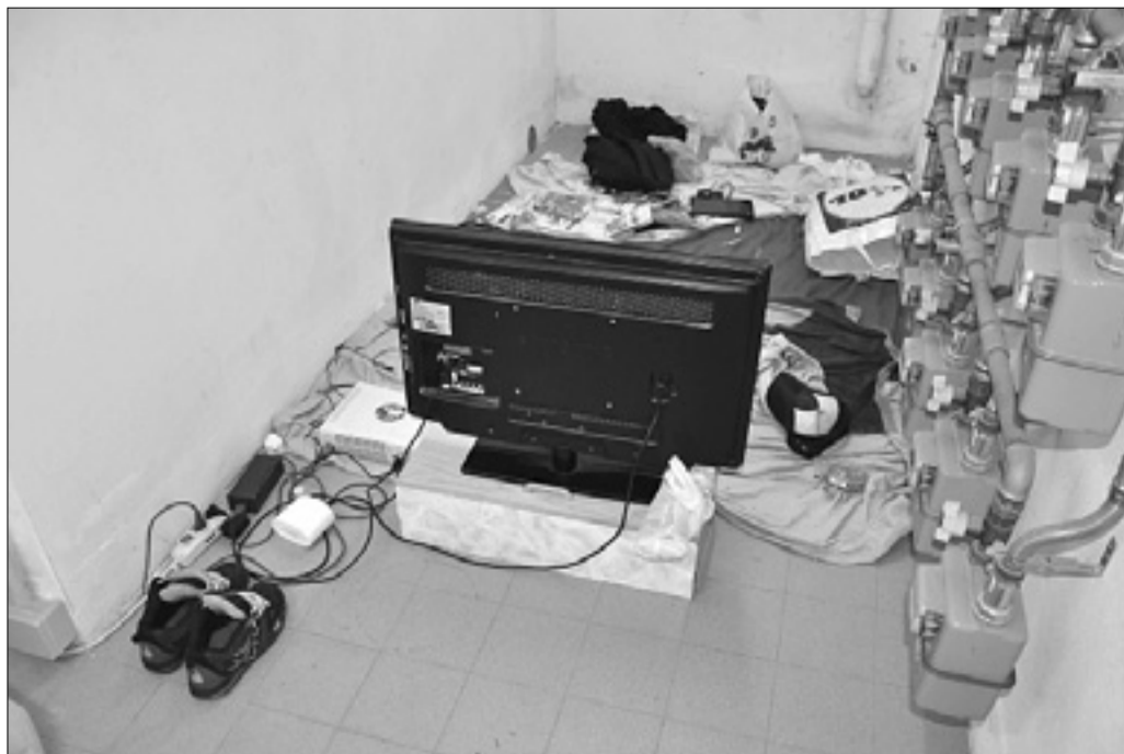
Mladenica sta prenočila ob števcih, kjer sta tudi črpala električni tok

Žrtev tatvine je poklicala policijo, ki je uvedla preiskavo. Okrog 7. ure zjutraj je klinični center 113 prejel obvestilo, da nekdo smrči v kletnih prostorih stanovanjske hiše pri Sv. Alojziju. Policista sta na prizorišču našla na speči fanta, televizor in drugo opremo ter električni kabel, priključen na števec. Mlada tatova sta priznala, da sta vse skupaj ukradla v rojanskem stanovanju, delna pa sta že prodala. Zlato ogrlico sta prodala v neki trgovini v tržaškem nakupovalnem središču, policija pa jo je naposled zasegla.