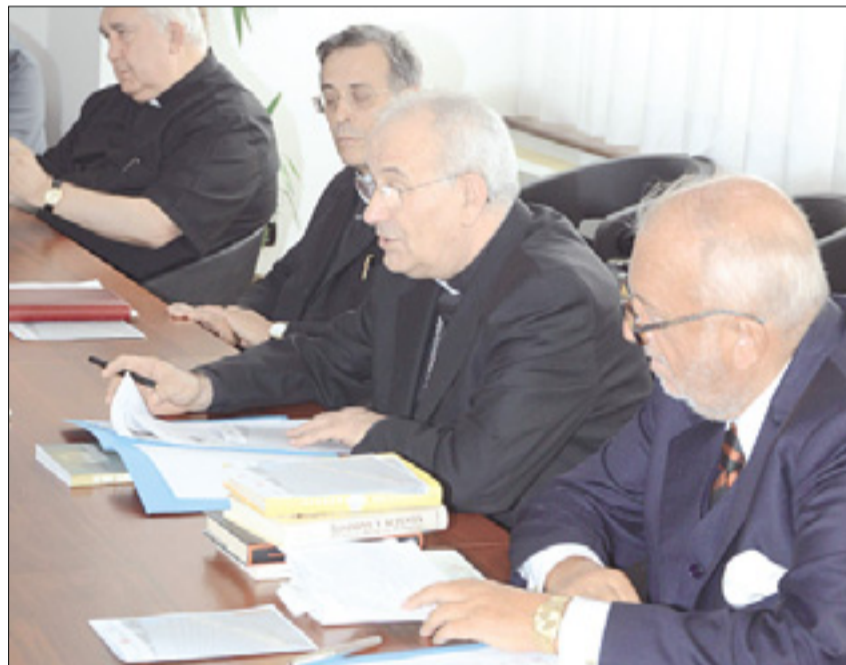
Škof Giampaolo Crepaldi (na sredi) na včerajšnji tiskovni konferenci

Prvi dve srečanja bosta potekali v muzeju Revoltella v Ulici Diaz 27 z začetkom ob 17.30, zadnje pa bo v škofijski palači v Ulici Cavana 16.