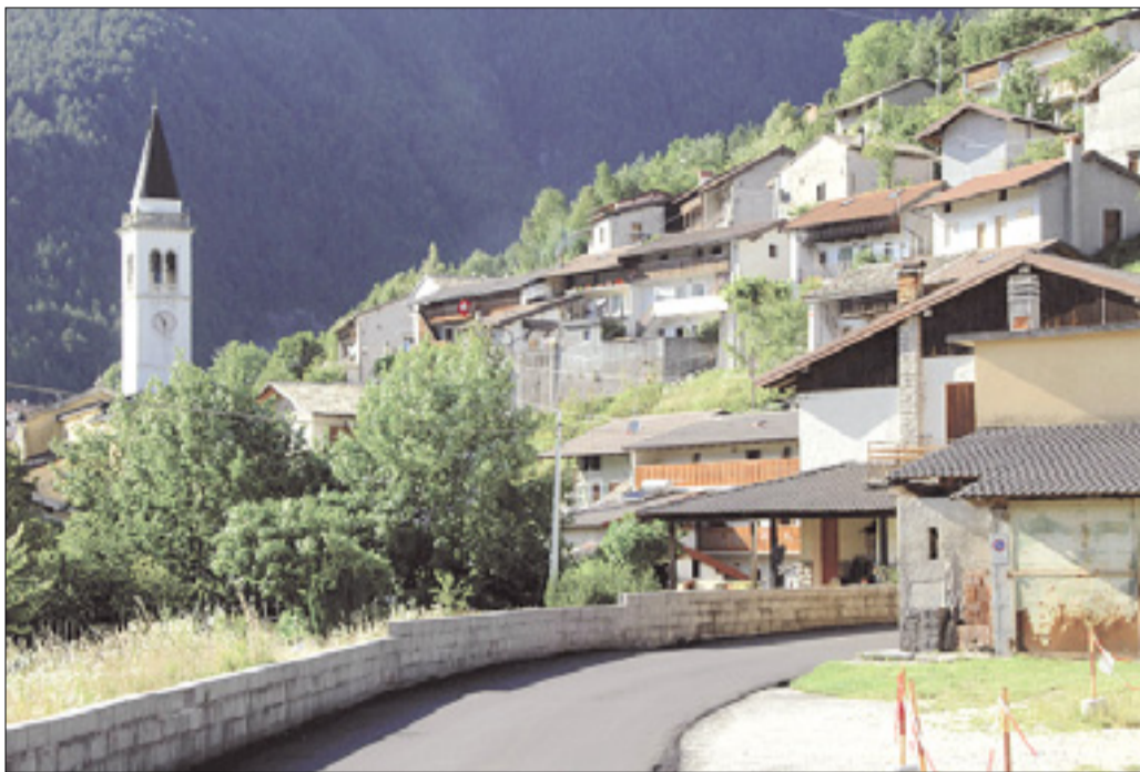
Solbica bo danes prizorišče zanimive kulturne prireditve

Zanimiva »razstava« bo obiskovalcem na ogled brezplačno do konca poletja, še posebej pa vabijo obiskovalce v Solbico 1. in 2. septembra, ko si bo na dvoriščih hiš mogoče ogledati vse bogastvo, ki ga ponuja zemlja na tem območju, razstavljeni bodo obrtni izdelki, nastopile bodo folklorne in glasbene skupine (tudi iz prijateljske Pliskovice), za ljubitelje sprehodov bodo organizirani izleti okoli vasi, seveda pa bo poskrbljeno tudi za gastronomske izdelke, ki jih bodo ponujali v alpski koči.