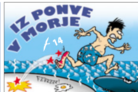
IZ PONVE V MORJE