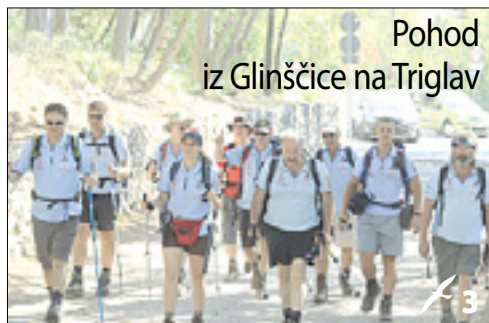
Pohod iz Glinščice na Triglav