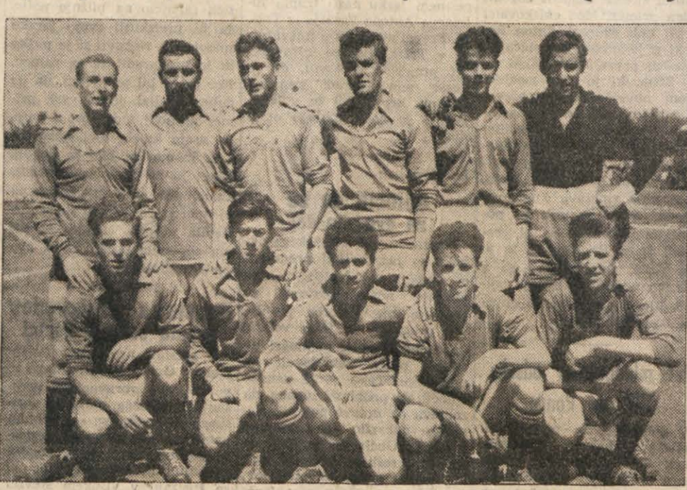
NABREŽINSKA ENAJSTORIČNA - ZMAGOVALKA TURNIRJA

posrečilo se jim bo v bodoče in ta trud jim bo brez dvoma stotero in stotero poplačal.