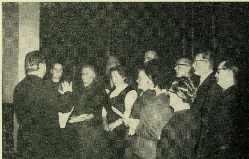
Pevski zbor DPD Svoboda pozdravlja zbor