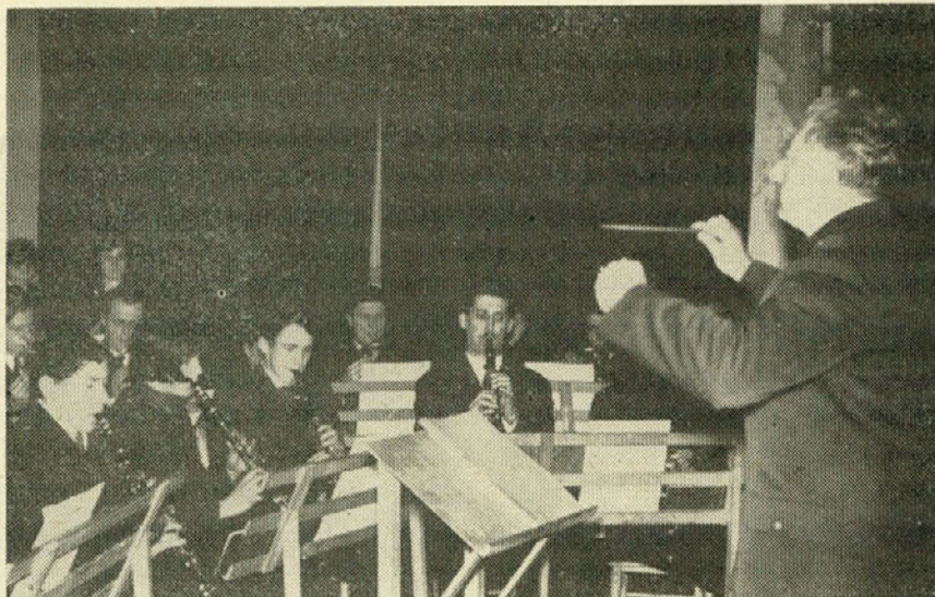
Godba na pihala pozdravlja občni zbor

Na koncu mi še dovolite, da povem le nekaj najosnovnejših podatkov iz bilance za preteklo leto in da te podatke primerjam z letom 1965.