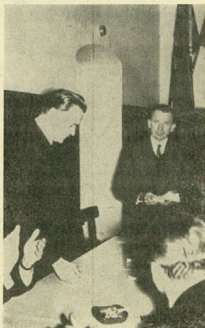
Direktor prejema priznanje