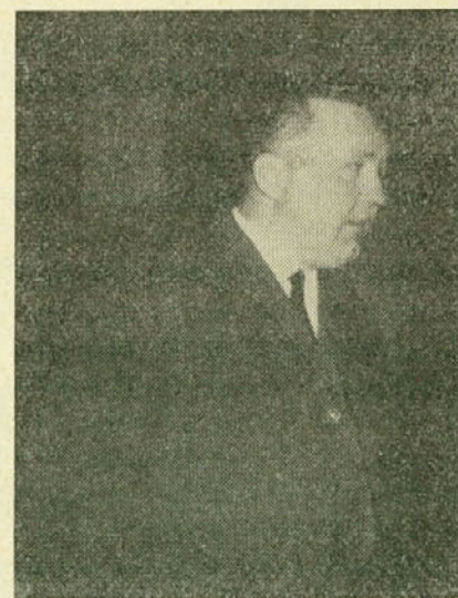
Predsednik podružnice — otvarja zbor

Regres za letovanje v Biogradu, Piranu, Pohorju, Selcah, Strunjanu in Kranjski gori je koristilo 43 članov kolektiva in 17 družinskih članov. Poleg tega pa je letovalo še v drugih krajih 15 članov kolektiva in 5 družinskih članov. V letu 1966 je bil v to svrhu izplačan regres v višini 742.730 S-din. V celoti pa je plačal sindikalni odbor oskrbino za letovanje 7 članom kolektiva.