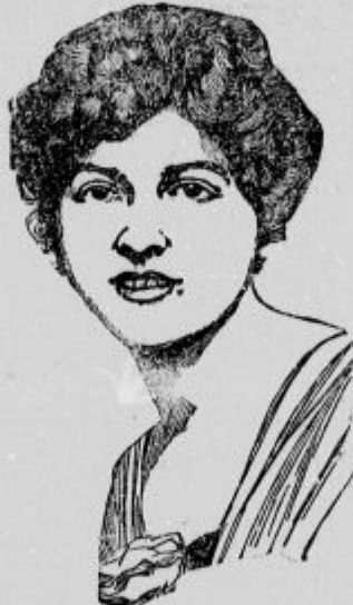
Princesa Frančiška Hohenlohe, nevesta nadvojvode Maksa, brata našega cesarja.

Kako bo pa zanaprej? Vlada je mnenja, da sila ni prava pot dobiti od zvestih ljudi, kar dežela in država rabita. Pri dobrem ljudstvu se bo s temeljitim poukom več doseglo, kakor s silo. Za kmeta je tako-le določeno: Vsak kmet dobi predpisano, koliko porabi zase, za svojo družino, svojo živino in za seme. Toliko in toliko pa ostane, torej mora toliko oddati. Če se ta načrt izpelje, potem ne bo rekvizicij treba. Res je ta načrt lep, če se bo le res prav izpeljal in se bo dalo kmetu, kolikor v resnici rabi. Saj je potreba kmetova po žitu čisto drugačna, kakor meščana. Če hoče svoje delo dobro opraviti, rabi dober delavec tudi močno hrano. Če bodo pa drugi kmetu kruh rezali, mu bodo veselje do dela vzeli. — Iz Romunije prihaja zdaj