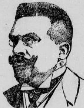
Avstrijski ministrski predsednik dr. Ernest vitez Seidler.

Ustavni odsek. »Vaška politika« — tako poročajo z Dunaja, je stopila v senco, odkar so slovanski poslanci nastopili kot neka celota in zedinjena skupnost v parlamentu. Jugoslovanski klub, ki ima sedaj precejšno vlogo in veljavo, je izjavil takoj izpočetka, da Jugoslovani ne marajo biti več razbiti na razne dele, ampak hočejo biti trdna celota v okvirju monarhije pod habsburškim žezlom. V doseg tega cilja bo treba stopiti v stik z Ogrsko, zlasti če bo jel ustavni odsek (36 članov), ki od njegovega dela pričakujejo najdalekosežnejših izprememb, z nameravanimi posvetovanji. — Glavna odločitev se bo po naši sodbi izvršila na bojiščih, kjer se bodo začrtale smeri bodočnosti. V Nemčiji se vrste skokoma preobrti, ki bodo brez dvo-