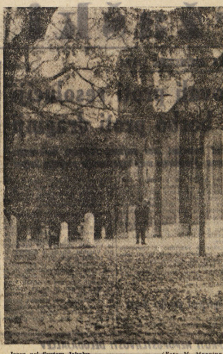
Jesen pri Svetem Jakobu

Francoski industrialci kupujejo zadnji čas čedalje več jekla