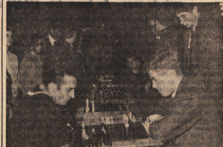
● Silke 6. slovenskega športnega tedna. Med šahovskim turnirjem

di velika krav. Bo ravno on tisti, ki bo igral veliko vlogo pri izbirljanju naše živinoreje. Zato danes ne postavljajo za plemo kar tjavdan nekakega bika, ampak prejšnjemu, kakšno potomstvo bo dal. Šele ko živinorejski strokovnjaki ugotovijo da so na potomstvu vidna zaželena svojstva — v našem primeru mišičnina in maščobnost — ga bodo uporabljali za množenje oplajenja.