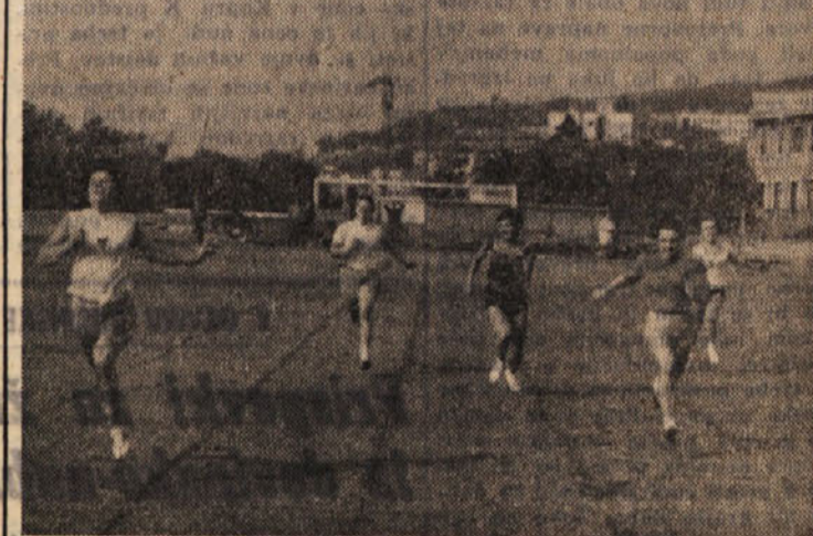
● ATLETIKA — finalni tek deklet na 80 m