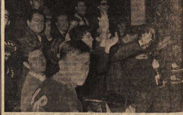
● KOSARKA — bučno navijanje za priljubljene barve