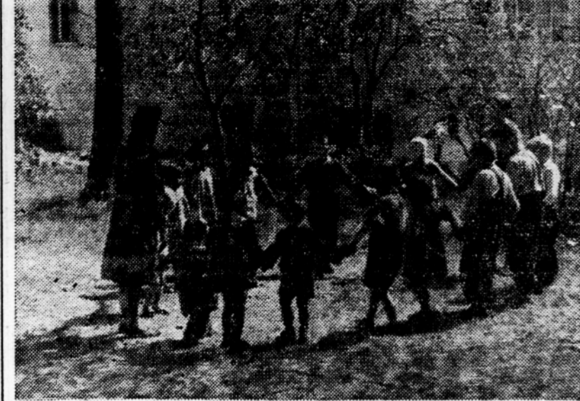
Pod nadzorstvom se деца igra pred svojim domom

V tem tednu so odprli otroška igrišča na Crnučah, v Medvodah in na