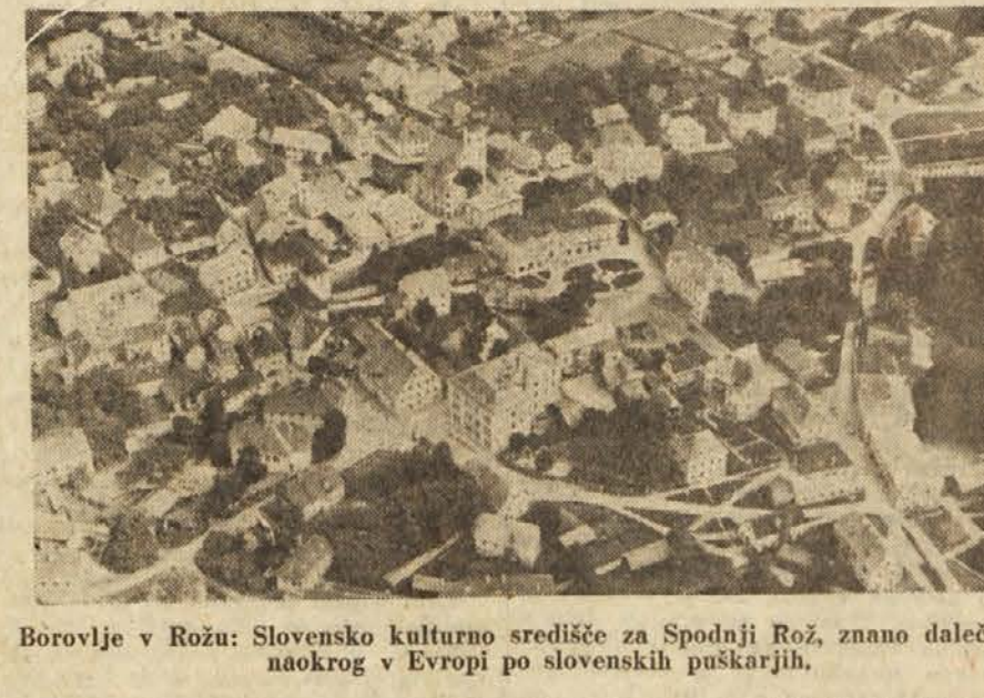
Borovlje v Rožu: Slovensko kulturno središče za Spodnji Rož, znano daleč naokrog v Evropi po slovenskih puškarjih.

Vrednost materiala, ki naj bi ga od januarja 1947 naprej dobavili ostalim deželam, znaša: Albanija 9.655.000 dolarjev, Avstrija 17.641.000, Belorusija okrog 12 milijonov, Češkoslovaška nad 45 milijonov, Dodekaneški otoki 94.000, Abesinija 334.000, Finska okrog 310.000, Grčija nad 29 milijonov, Madžarska nad poldrug milijon, Italija nad 119 milijonov, Korea 822.000, Filipini 4.525.000, Poljska blizu 68 milijonov, Ukrajina nad 29 milijonov, Jugoslavija nad 56 milijonov in Kitajska nad 269 milijonov dolarjev.