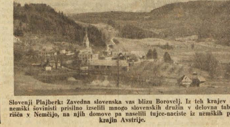
Slovenj Plajberk: Zavedna slovenska vas blizu Borovlje. Iz teh krajev so nemški šovinisti prisilno izselili mnogo slovenskih družin v delovna taborišča v Nemčijo, na njih domove pa naselili tuje-naciste iz nemških pokrajin Avstrije.