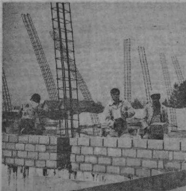
S sredstvi iz drugega samopriskevka bo zrasel ob Dečkovi ulici vzgojni zavod Janeza Levca. Gradi ga SGP Graditelj iz Kamnika. Objekt bo dograjen maja prihodnjega leta.

Dolga je torej pot, da predlog, ki sploh ni slab, pride do pristojnih. Če bo Ljubljanski urbanistični zavod ravnal prav tako spoštljivo, bomo čez nekaj let lahko ob Gramozni jami zagledali nov. Ljubljani, predvsem pa občini, prepotreben park. Ker vsi dobro vemo, koliko let je potrebnih, da zrastejo drevesa, lahko z gotovostjo trdimo, da je čas, ko bo nov spominski park povsem nared, še zelo daleč.