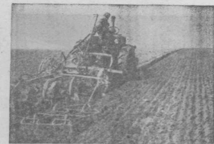
Jesenska setev se je pozno začela. Do 9. novembra je bilo sa-sejano v Sloveniji 95%, v ožji Srbiji 80%, v Vojvodini 78%, na Hrvaškem 65%, v Bosni in Hercegovini 45% in v Makedoniji 45%.

To vprašanje se ne zastavlja prvič. Že več let dvigamo glas proti grdemu, dragemu, nepraktičnemu in do skrajnosti nestetskemu pohištvu, proti brezbriznosti podjetij, ki izdelujejo razno pohištvo in predmete vsakdanje rabe. Kaže