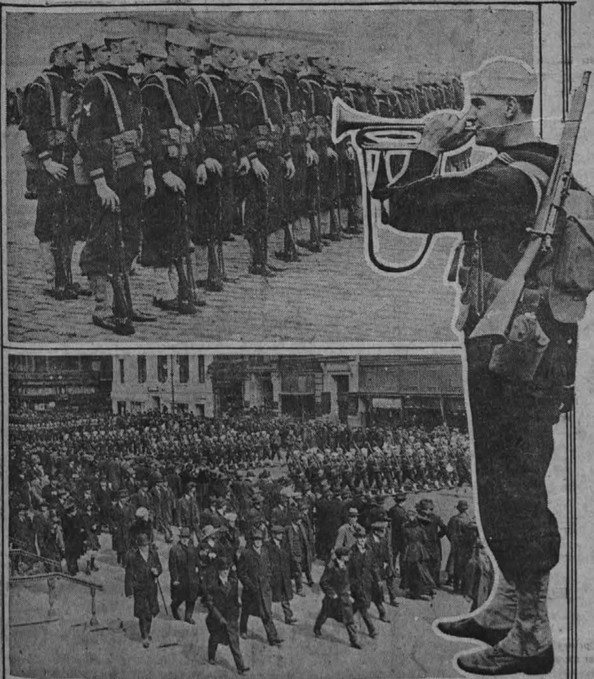
POMORSKA MILICA, PRVA V VOJNI SLUŽBI, MED POTJO NA LADJE V PHILADELFIJI.