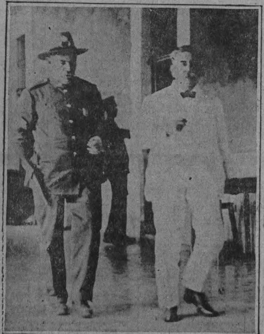
POGLAVAR KUBANSKIH UPORNIKOV IN NJEGOV JETNICAR.

Fred Lehring Brewing Co. JOLIET, ILL. PIVO V STEKLENICAH. Cor. Scott and Clay Sts. .... Both Tel ephones 26. .... JOLIET, ILLINOIS