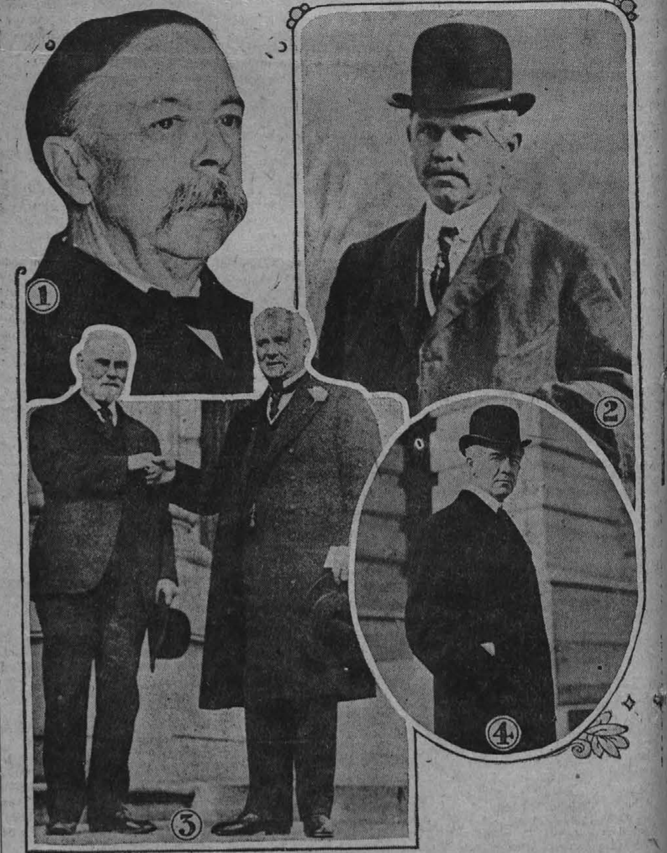
MOŽJE, KI IGRAJO P RVE ULOGE V POSEBNEM ZA ŠEDANJU KONGRESA.

V sedanjem zasedanju kongresa igrajo odlične vloge sledeči možje: Št. 1. senator Chamberlain iz Oregona; št. 2. reprezentant Flood iz Virginije; št. 3. James R. Mann in Champ Clark,