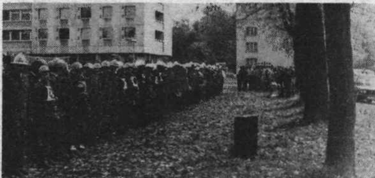
Občinski štab za civilno zaščito je pripravil 8. oktobra pregled za zamudnike (prvi občinski pregled je bil junija) in pregled za gasilske enote civilne zaščite. Oba pregleda sta bila na območju KS Poljane. Splošne in specializirane enote CZ so pokazale visoko stopnjo usposobljenosti.

V okviru nabornih priprav in nabora bo konec meseca tudi slavnostna podelitev vojaških knjižic.