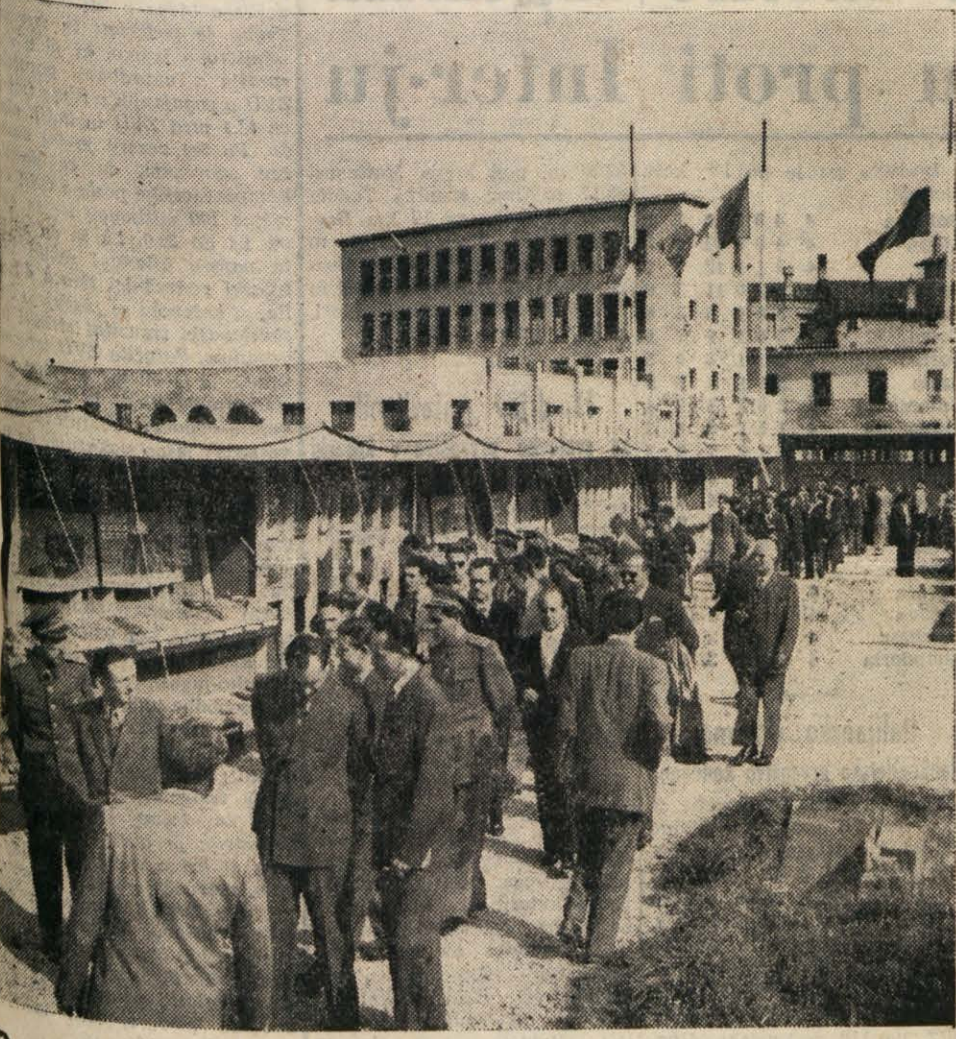
Otvoritev III. razstave gospodarske dejavnosti Istrskega okrožja

Platac je ena izmed vasi grške občine. Ker bližnje vasi nimajo lastne šole, so otroci iz Kanala, Spodnjega in Gornjega Grmeča in Gornjega Brda prisiljeni obiskovati šolo v Placiu. Ker pa niti v Placiu ni za pouk primernih šolskih poslopj, so oblasti že 1946, leta sklenile, da bodo zgradile novo šolo. Pisano leto 1950 in zadeva se še vedno ni premaknila z mrtve točke. Ostale so samo obljube, od katerih pa niti prebivalstvo, niti učiteljstvo, še manj pa otroci, nimajo nobenih koristi. Z otroškim vrtem ni dosti na boljšem. Da bi vsaj delno rešili to vprašanje, bi kazalo zaenkrat urediti prostore, v katerih je sedaj mlekarina. Seveda tudi to samo pod pogojem, da bi preskrbeli mlekarini nov lokal.