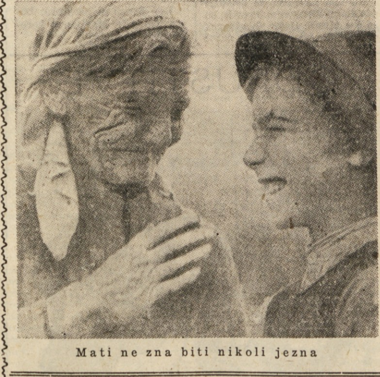
Mati ne zna biti nikoli jezna