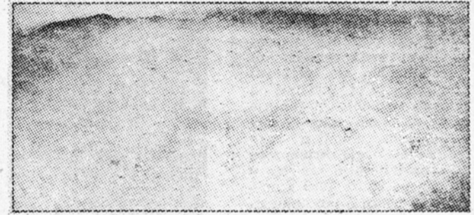
Megla! Nič ne vidite? Saj to je tisto. Pod to meglo se vsak dan skriva nekoč sončno mesto angelov: Los Angeles.

To stanje postaja posebno nevarno za življenje mestnih prebivalcev v času gostih me-