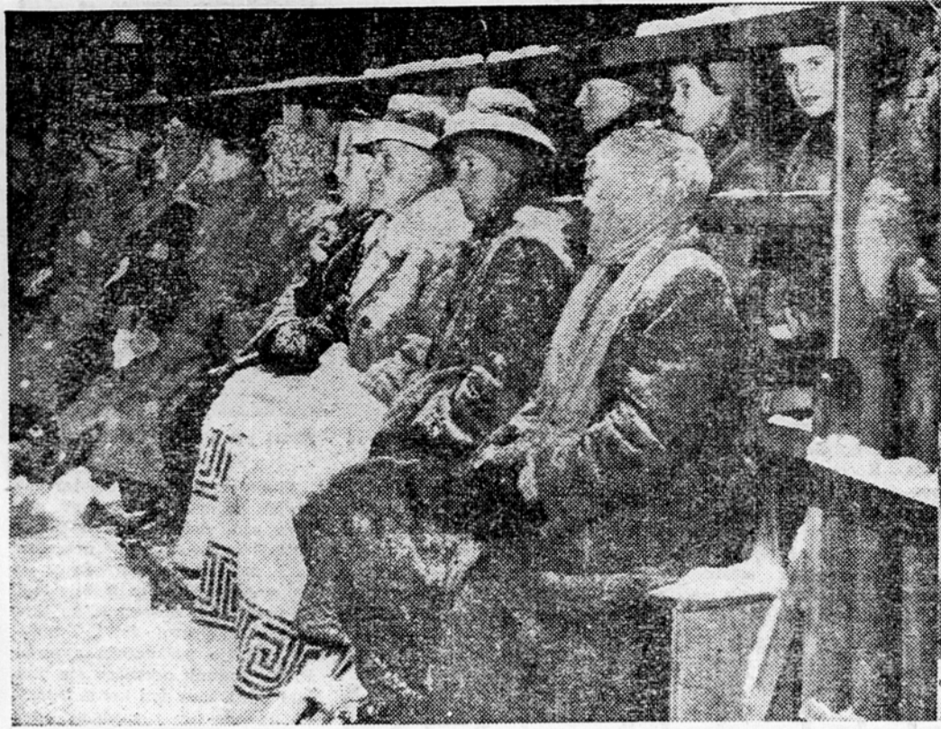
Vztrajnih gledalcev, ki so občudovali mojstre drsanja na svetovnem prvenstvu v avstrijski prestolnici, sneg ni niti najmanj motil. Dobro zaviti in pokriti (saj pravijo, da tudi sneg greje) so potrpežljivo sedeli in gledali.

Leta 1931 dograjeni orjak Empire State Building je dobil novega gospodarja