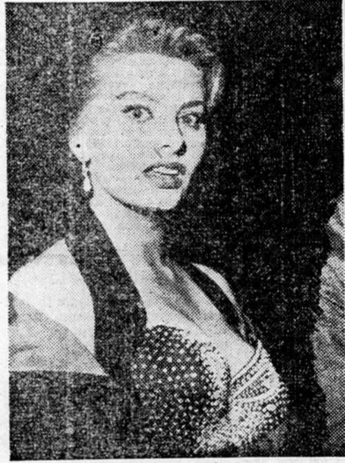
Sramežljiva Sophia Loren

Sophia Loren je tožila italijansko ilustrirano revijo, ker je objavila sliko njenih nog — Zagovornikova disertacija o morali nog