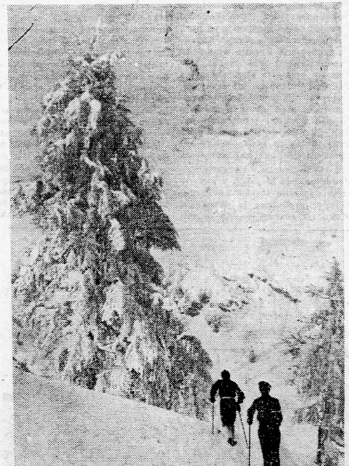
Naši smučarji in posebno še gosti neni v zimskih turističnih postojankah so že skoraj popolnoma opubali nad letošnjo zimo in čela za letošnji planiški tečen je sta bo kazalo. Končno pa je le zapadlo toliko snega, da bodo lahko vsi prišli na svoj račun. (Na sliki zasnežena Komena, ena tzm ed najbolj priljubljenih smučarskih postojank.)

Ob koncu razprave so sestavili komisijo, ki bo na podlagi predlogov, podanih v razpravi, izdelala skupno resolucijo, kot osnovo za nadaljnje sodelovanje med sindikati in društvi inženirjev in tehnikov.