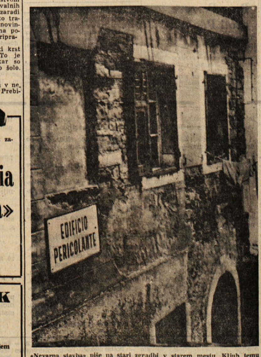
«Nevarna stavba» piše na stari zgradbi v starem mestu. Kljub temu pa še vedno nekdo v njej stanuje, ker mu gotovo ni bde ne more zagotoviti boljše stanovanje