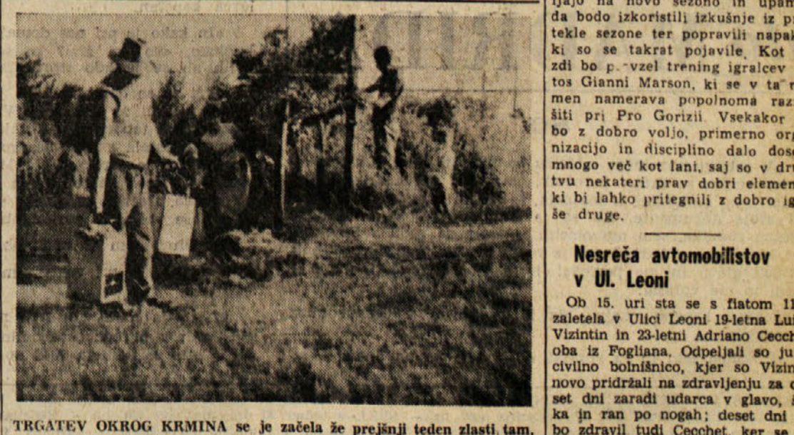
TRGATEV OKROG KRMINA se je začela že prejšnji teden zlasti tam, kjer je grozde začelo bolj močno gniti. Pri tem delu mora pomagati vsa družina