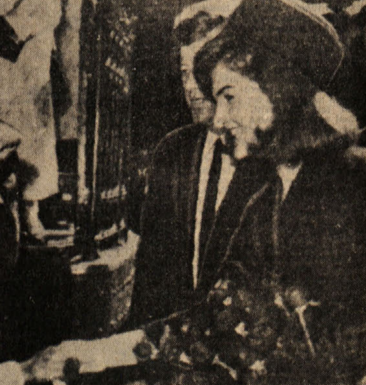
Etiopski cesar, ki je prišel na uraden obisk v Washington, pozdravila Kennedyjevo soprogo, Jacqueline je kmalu nato z letalom odpotovala v Grčijo, kjer bo prebila dva tedna počitnic