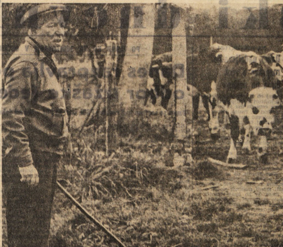
Francoski filmski umetnik Jean Gabin, ki se dejansko kličje Jean Alexis Monceorge, se baje umika iz filmskega življenja. Sicer je to že večkrat nameraval, pa so ga zanimali spet za kamero. V Normandiji ima veliko posestvo, kamor se pogosto umakne na počitnice. Tu pa je imel že več sporov s svojimi spolovinarji in poljskimi delavci.