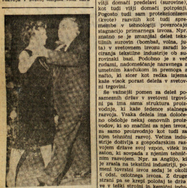
Spejni leader angleških laboristov Harold Wilson z ženo tudi zapleče, kot kaže slika. Bilo je to na neki slavnosti v Scarboroughu v času kongresa stranke