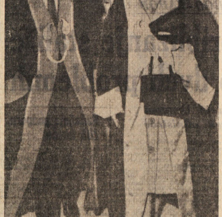
Perzijska cesarica Farah Diba, ki je študirala v Parizu arhitekturo pa študija zaradi poroke s šahom ni dokončala, je sedaj dobila na tehranski univerzi častno diplomo. Na sliki je z akademsko togo poleg moža

sko opremo, proizvode kemične, strojne, elektrotehnične in električne proizvodnje, medtem ko mnogi rudniki, njihova tekstilna, obutvena, konfekcijska, galanterijska, pa delno tudi jeklarska industrija vedno bolj občuti svetovno konkurenco. S tem v zvezi se postavljajo vprašanja, ali je izredno hiter razvoj tehnike v razvitih državah hkrati tudi že obsejna država v razvoju, da gradijo svojo industrializacijo in izvoz na tistih panogah, ki nimajo več perspektive v razvitih območjih zaradi nizke produktivnosti in visokih mezd. Ceravno še danes prevladujejo take tendence v svetovni trgovini, je vendar za dolgoročno perspektivo odgovor negativen, za kar je več razlogov. Izrednega pomena je že sama politična samostojnost držav v razvoju, kar jim omogoča ekonomsko politiko pospešene razvoja kot tudi forsiranje določene produktivnosti, kot je nacionalno povprečje. (Npr. jeklarska industrija v Indiji, aluminij v Gani, atomsko energija v Kitajski). Najbolji primer negacije take tendencije je mogoče najti ravno v strukturi proizvodnje in izvoza socialističnih držav. Poleg tega tudi boljši pogoji mednarodnega financiranja omogočajo uveljavljanje tehničnih dosežkov, tako da imajo gospo-