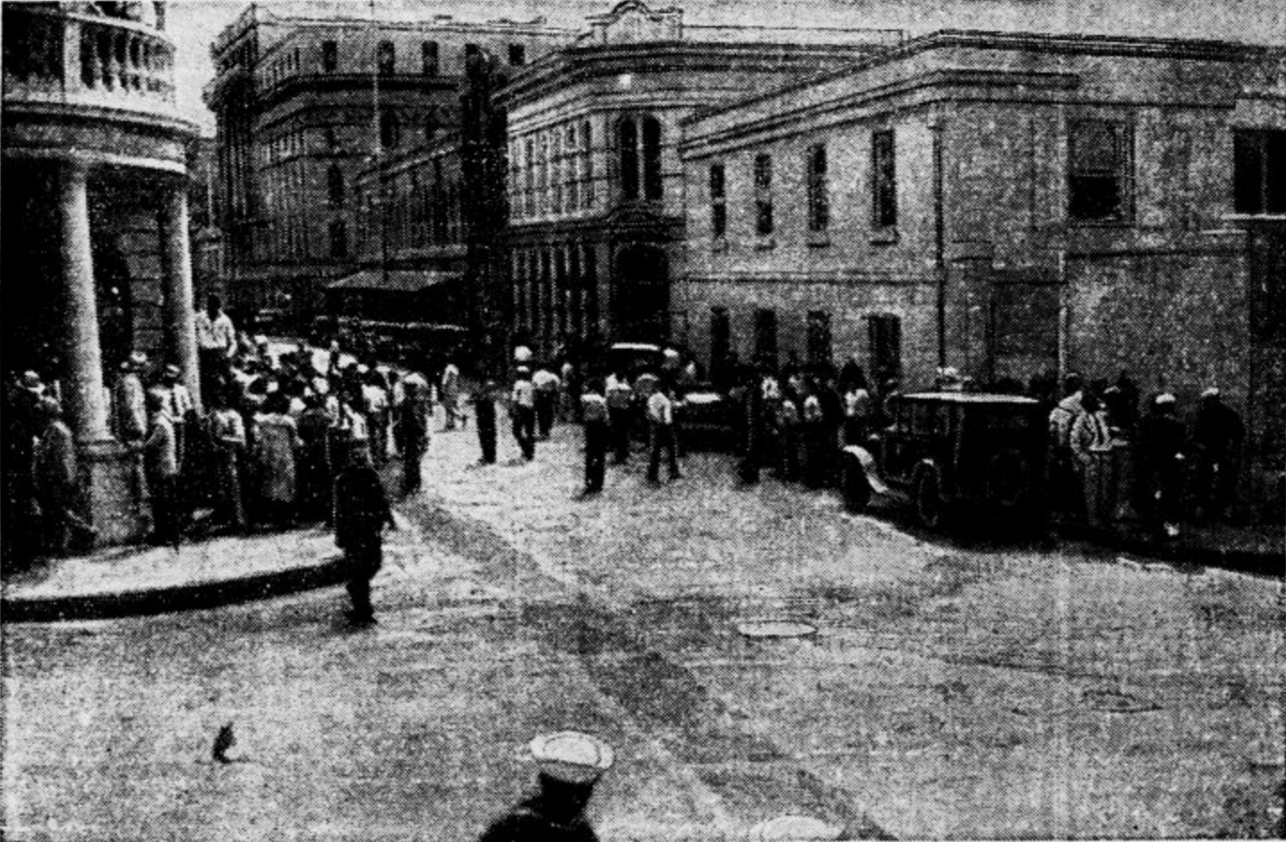
Slika je sneta v trenutku aretacije miss Fortescue v Honolulu

izprehajala in študirala življenje, napadli iz zasede kakor divji leopardi in ji baje storili silo. Kraj dejanja je ameriška pomorska baza v Pearl Harbourju z luksuznim življenjem bogatih letoviščarjev v Valikiuju. Na drugi strani pa mračni »Devils Half Acre«, prava polneziška Subura, kjer se zbirajo zločinci vsega Pacifika in ki je po svojih dejanjih še daleko bolj proslula od znamenitih zločinskih okrajev: »Looc« v Chicagu in »Peklenška kuhinja« v New Yorku.