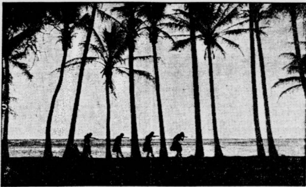
Havajska obrežna pokrajina ponoči

Vse okoliščine tega umora so bile tako zagonetne, da so napravile iz tega prvega dejanja afere eno tistih senzacij, ki globoko razgibajo ljudsko fantazijo, ki se ponavadi razvijajo v romanah, v filmu, in le redko tudi v resničnem življenju. Najprvo je bila izredna že sama osebnost akterjev: Na eni strani žrtev: izredno lepa ženska, stara komaj 20 let, iz bogate družine, ki zavzema v Washingtonu prav odlično pozicijo in ki je prišla semkaj v oceanski paradiz uživati sladkosti življenja. Na drugi strani krdolet petih domačinov, ki so jo ponoči, ko se je sama