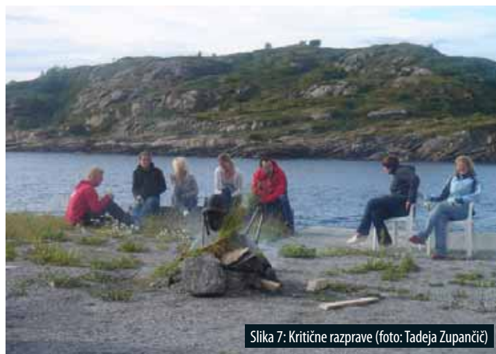
Slika 7: Kritične razprave

The Faculty of Architecture from Ljubljana continued its active role in the series of Erasmus IP on Building Anatomy, coordinated by the school of architecture from Vaduz. In 2007 the topic was derived from the nordic tectonic tradition, focused on wooden construction and details. The workshop started with 1:10 physical conceptual models and ended with 1:1 physical realization of wooden stands for local fairs in Hopsjobrygga on the Hitra island near Trondheim. The organizer (NTNU) was supported by 4 known partners from the previous workshop, and a guest university from Egypt. The difference of the last workshop in the series, in comparison with the previous two, was the introduction of 1:1 physical prototyping in-between the design conceptual phase of 1:10 modeling and the final 1:1 realization phase.