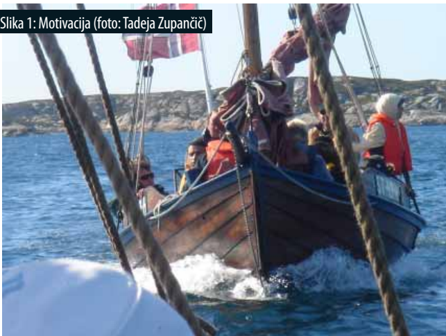
Slika 1: Motivacija