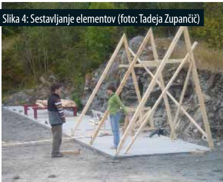
Slika 4: Sestavljanje elementov