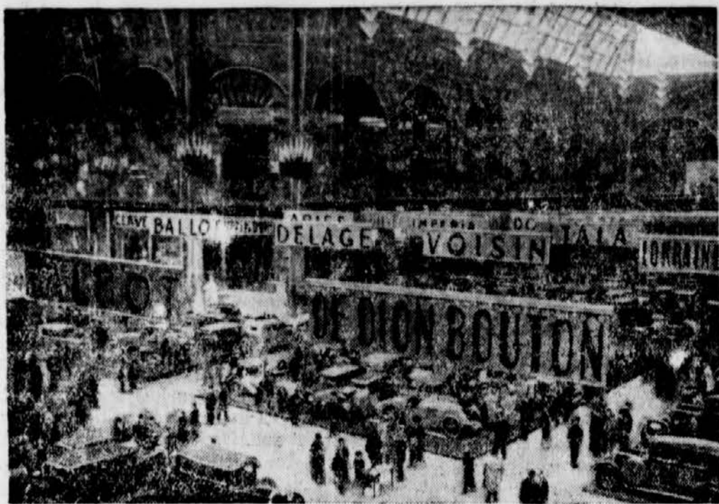
auf der zum ersten Male auch wieder deutsche Firmen wie Mercedes-Benz, Daimler und die Bayerischen Motorenwerke ausgestellt haben.