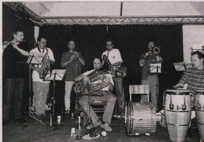
Člani nenavadnega orkestra Džungle so vžgali v Šentjanžu.

Že sam sestav orkestra – osem pihalcev in en bobnar – je vzbudil pri številni publikii radovednost za njihov glasbeni repertoar. Glasbeni koktejl je segel od narodne glasbe, komadov slavnega ameriškega entertejnerja Franka Sinatre, Paula Anke do tibetanske sakralne