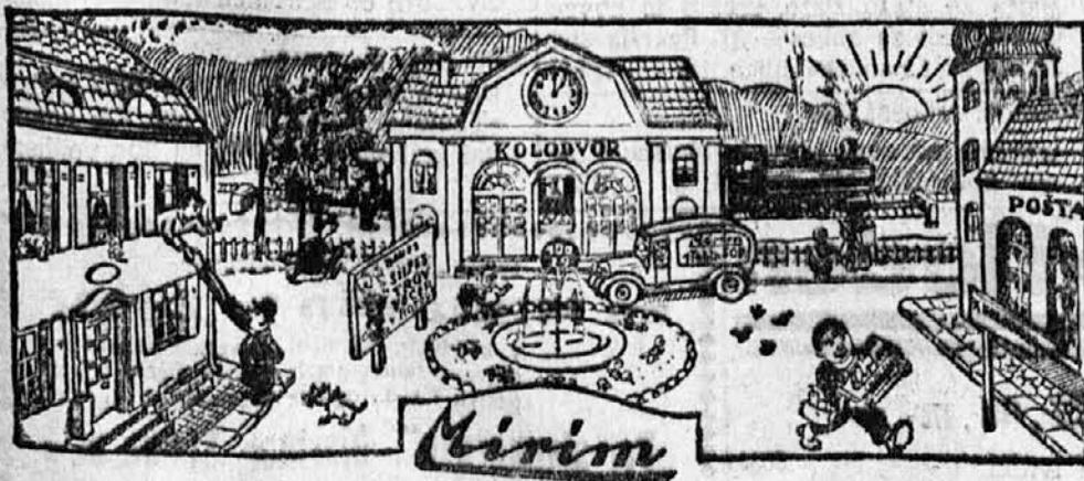
Slika ima 11 napak. Kdor jih ugaane in priloži 15 nagradnih listkov z raznimi črkami, ki se nahajajo v vseh tablicah, MIRIM-čokolade, dobi kot prvo darilo okrašeno božično