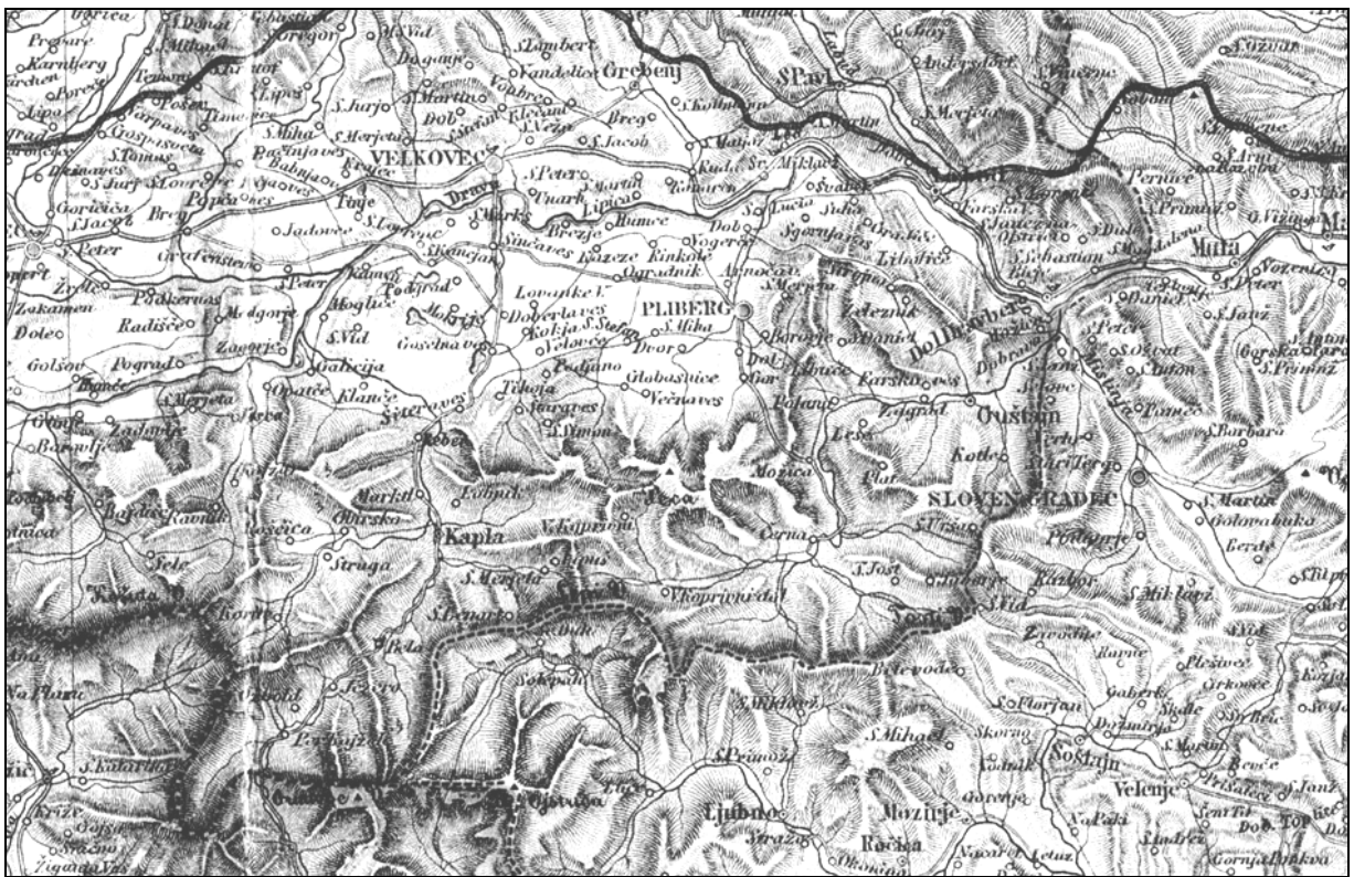
Meja med Koroško, Štajersko in Kranjsko (Peter Kozler, Zemljovid Slovenske dežele in pokrajin, 1863).

Ravnah. Po osamosvojitvi Slovenije so Mežiški rudnik začeli postopno zapirati, s proizvodnjo so prenehali ob koncu leta 1994 in začeli sanirati poškodovano pokrajino v okolici. Na temeljih rudarske dejavnosti je nastala predelava svinca v podjetju TAB, ki je največje podjetje v Zgornji Mežiški dolini. Železarna Ravne je v devetdesetih letih prejšnjega stoletja doživela velike reorganizacijske spremembe. Na isti lokaciji so nastala številna manjša podjetja, ki so vezana na železarsko tradicijo. Kmetijstvo in gozdarstvo se ohranjata v odročnih hribovskih predelih; s to dejavnostjo se preživlja vedno manjše število ljudi.