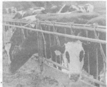
stalo za kmetijske proizvajalce zanimivejše šele zadnji dve leti, ko sklad za intervencije v kmetijstvu mesta Ljubljane, za zavarovanje načrtovane - kooperacijske kmetijske proizvodnje prispeva del sredstev za plačilo zavarovalne premije.

Odločitev o tem, da želite svojo živino zavarovati čimprej, sporočite na izplačilno mesto zadruge, pospeševalcu, mlečnemu kontrolorju ali direktno zavarovalnemu zastopniku vašega področja.