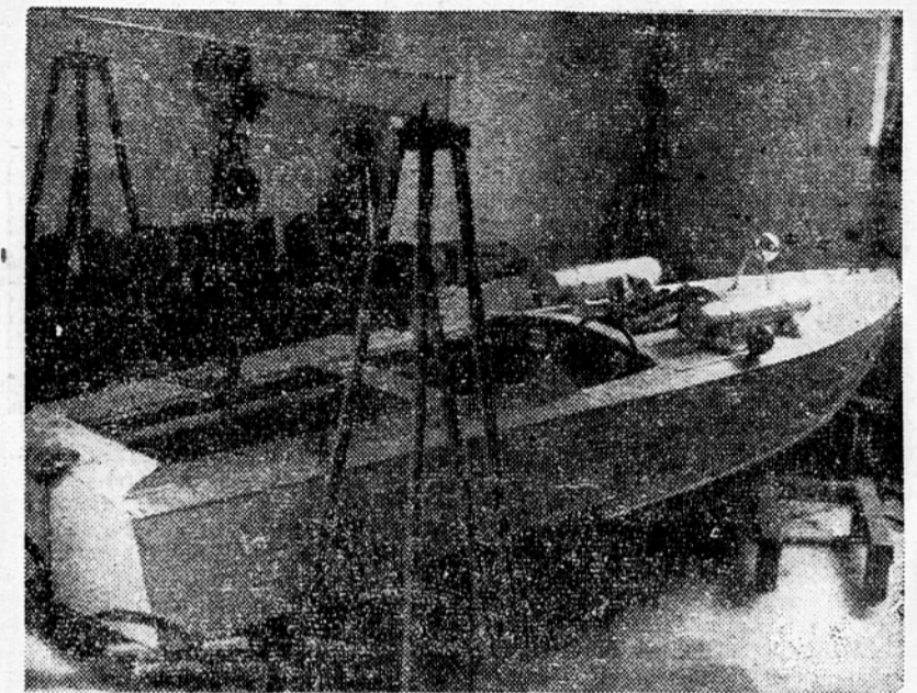
Motorni ocn, ki ga izdelujejo člani pomorsko - brodarskega društva v hidrocentrali na Mariborskem otoku