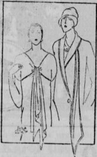
ROKAVI IN NAPRSNIK

iz sukna ali svile, oblika je lahna in živahna in je posebno prikladna za vitke, mladostne postave. V obliki »bolero« so ali jopice same zase iz drugega blaga, ali celotne obleke ali pa jopica pri kostumu ali zgornji del plašča. Na pričujoči sliki vidiš take obleke.