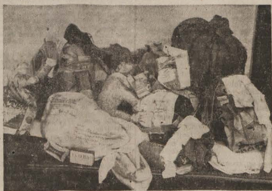
Iz nekaterih paketov pokradejo na tržaških postajah le boljše stvari in tako ostanejo v vagonih najrazličnejši predmeti, večinoma poškodovani, ki jih ni mogoče odposlati, ker ne vedo — čigavi so.

Zavezniška vojaška uprava ni naši poštni upravi dovolila, da bi imela v Trstu ekspozituro, da bi sama skrbela, kontrolirala in ščitila vagone. Na drugi strani pa zavezniška vojaška uprava ni prav nič storila, da bi bil na postajah uveden red, da bi bili vagoni zaščiteni. Našla še ni nobenega vlomilca v vagono, ki hodijo večkrat z brzostrelkami, dočim je imela čas zasledovati, aretirati in prepetati tržaške antifašiste. Naša poštna uprava in njena kontrola funkcionirata tako dobro, da na naših železnicah in postah tatvine niso mogoče. Zato pada vsa odgovornost za vlomljene vagone, za pokradene pakete in druge pošiljke, ki zmanjkajo na tržaških postajah, na zavezniško vojaško upravo.