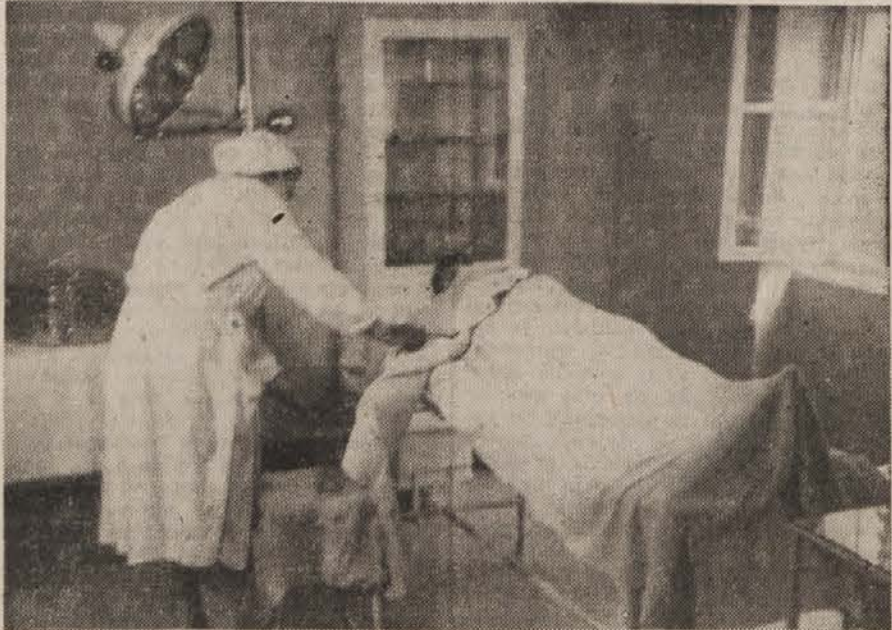
Odvzem krvi v operacijski sobi

na roki se vzame kri v sterilne steklenice. Registrator nanje vpiše natančne podatke. Steklenice krvi, ki se hranijo v ledenici, se ne izdajo, dokler niso izvršene vse preiskave krvi kemično, hematološko in bakteriološko. Izključni se tako vsako krvno obolenje, predvsem vreten pa je pregled krvi na Lues.