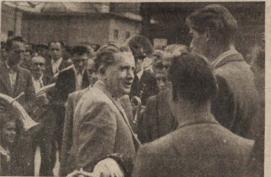
Tovariš predsednik vlade se razgovarja z jeseniškimi delavci

hov. Sodelovanje delavcev in kmetov je vedno in bo tudi v naprej dalo odlične rezultate. Mnogo se da rešiti tudi na ta način, da se lokalni funkcionarji oblasti, kakor tudi vsi volivci bolj zanimajo za svoje lokalne gospodarske probleme, da jih skušajo rešiti s tem, da zlo odpravijo kar na licu mesta.