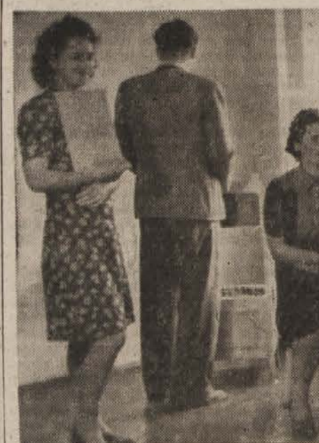
V hematološkem laboratoriju ugotovijo krvodajalca krvno skupino in odstotek krvnega barvila

Opaža pa se pojemane števila krvodajalcev. Zato pozivamo krvodajalce, da še vnaprej rešujejo s svojo krvjo bolniške, porodnice, delavce, ki so se pone srečali pri delu, ali tovaršice, ki so težko oboleli. Prazna je bojazen novih krvodajalcev, da je večkratni odzem krvi škodljiv. Ako je stalen gost zavoda, je pod tako zdravniško kontrolo, da ga ob najmanjšem sumu bolezni odklonijo in