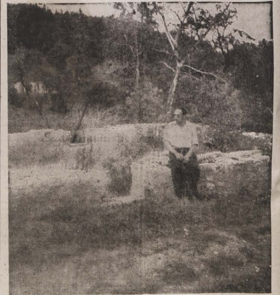
Ostanki poda, kjer je bilo 9 Hrastničanov živih sežganih