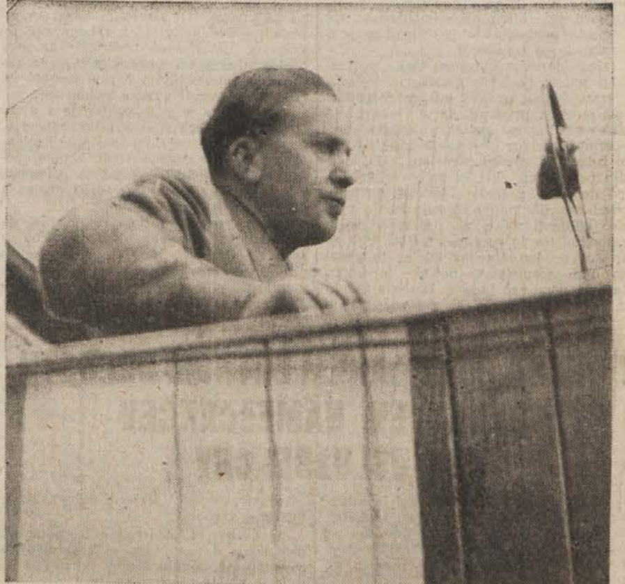
Predsednik vlade LRS, tovariš Miha Marinko, govori na zborovanju na Titovem trgu na Jesenicah pred 6000 Jeseničani

(Po »Proglasu« antifašističnih organizacij Julijske Krajine.)