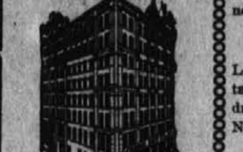
Podružnica: 11 BROADWAY, NEW YORK, katere se prva ulica s prodajalnimi stanovi vseh svetovnih držav.