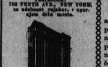
Podružnica: 782 TENTH AVE., NEW YORK, na ulovni ulici, v zgornjem delu mesta.