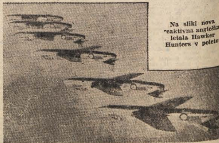
Na sliki nova reaktivna angleška letala Hawker Hunters v poletu

še za 7, druga ameriška družba American National Airlines pa je naročila 12 letal Comet III. Ko so bili vsi ti posli že sklenjeni, pa je angleška vlada sklenila vzeti ta potniška letala iz prometa, ker se je pripetilo več nesreč, ki jih niso mogli pojasniti. Zdaj proučujejo angleški strokovnjaki vzroke teh nesreč, da