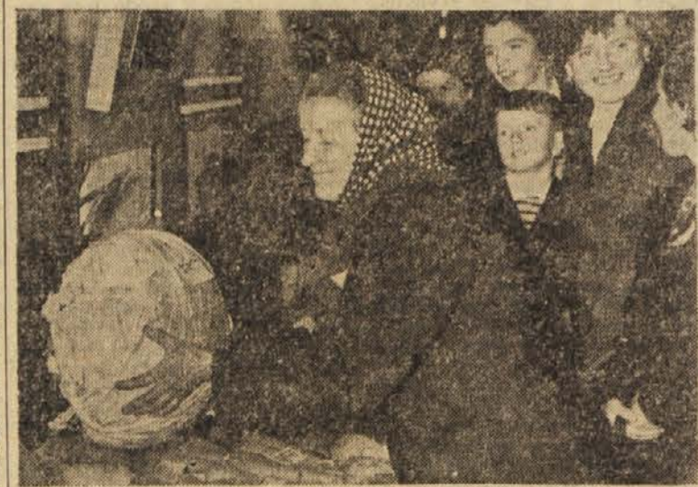
Z razstave ob Gorenjskem kmetijskem tednu: 9 in pol kilograma težka zeljnata glava

Nadpovprečni letošnji pridelok žita seveda ni samo posledica vremenskih pogojev, ki niso bili posebno ugodni, čeprav boljji kakor lani. Na večji hektarski donos je bistveno vplivala tudi večja poraba umetnih gnojil in sortnega semena v okviru splošne akcije za povečanje kmetijske proizvodnje in pa uporaba vseh drugih agrotehničnih ukrepov, ki se v čedalje večji meri uporabljajo v našem poljedelstvu.