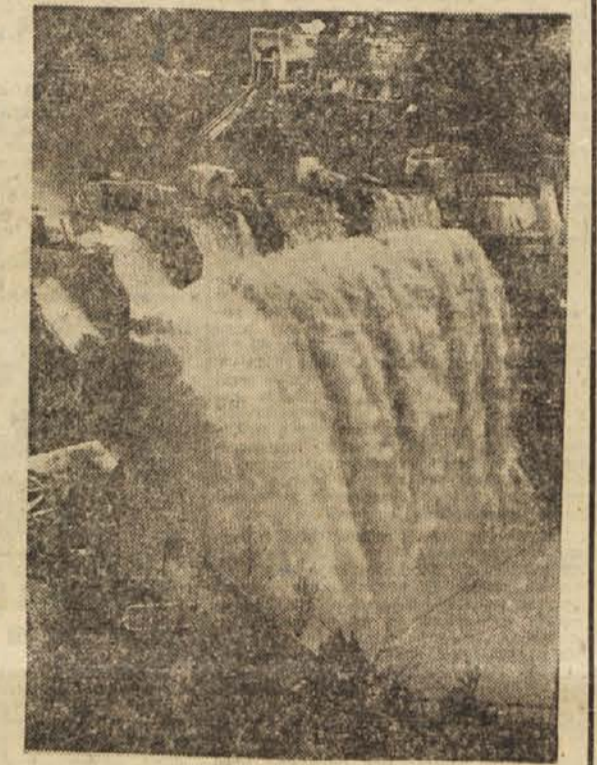
Jez na jezeru elektrarne Jablanice

Hidromontaža je od svoje ustanovitve montirala vseh dvajset velikih in nekaj manjših central v državi od Mariborskega otoka do Jablanice. Sestavila je že 51 turbin, prav toliko generatorjev s 508.000 KVA, ki oskrbujejo našo industrijo. Naloga monterjev Hidromontaže je sestavljati vse hidroelektrarne opreme od zapornice in cevvodov do turbin in generatorjev, prav tako pa tudi vse električne naprave (transformatorje, razdelilne in komandne naprave itd). Koliko je tu potrebnega znanja in spretnosti, da ne govorimo o naporih, najbrž ni treba posebej pisati. Če dodamo še to, da moramo plačati predstavniku monterju inozemske firme, ki eventualno prisotvuje montaži zaradi garancije, razen slavnostnega dnevo se 1500 dinarjev, firmi pa 32 milijonov, nam sposobnost naših monterjev tem bolj vzbuja spoštovanje. Toliko o teh ljudeh, okrog 400 jih je, in se z vsemi drugimi bori na jezovih Drine, Neretve, Drave, Zete, Save in vseh ostalih naših velikih rek.