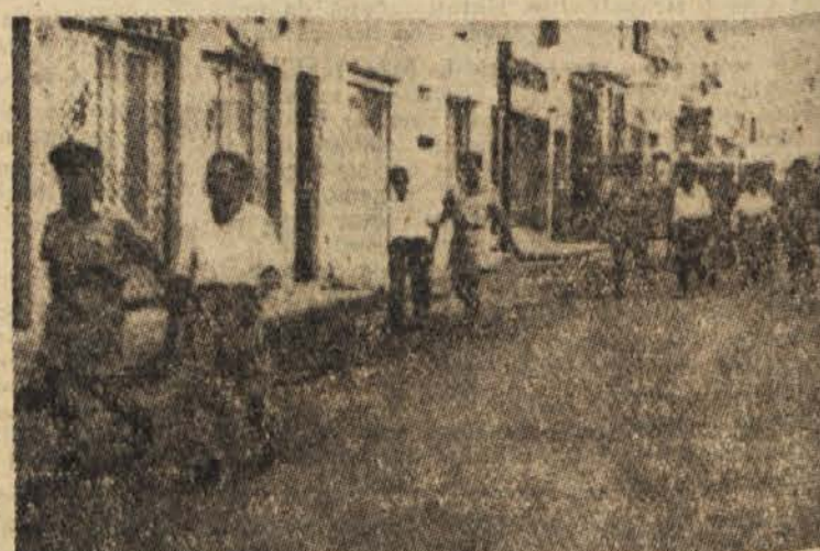
Ob zadnjih demonstracijah na Cipru je policija zaprla večje število ciprskih mladeničev. Na sliki vidite, kako policaji vodijo posameznike v zapor.