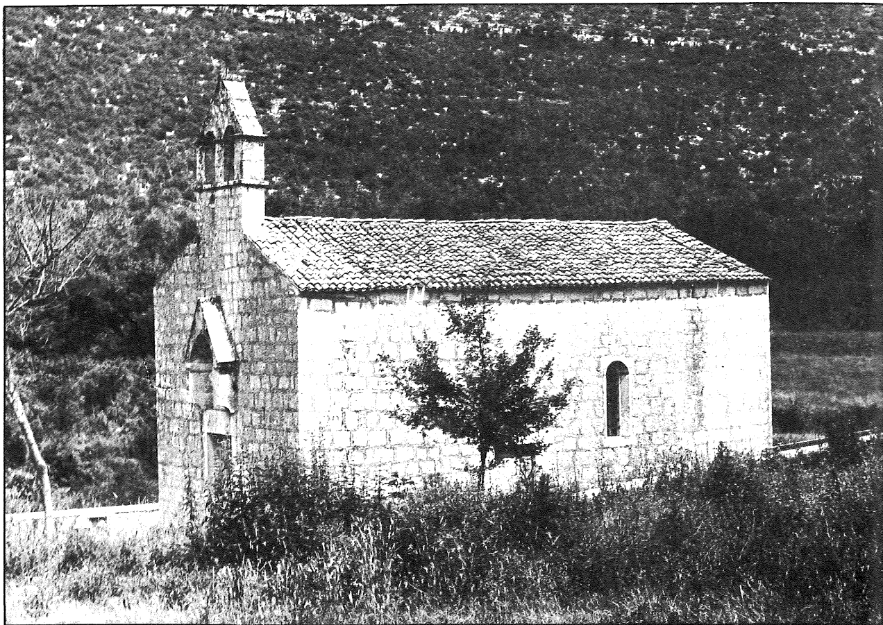
Cerkev Sv. Marije na pokopališču pod Dvigradom