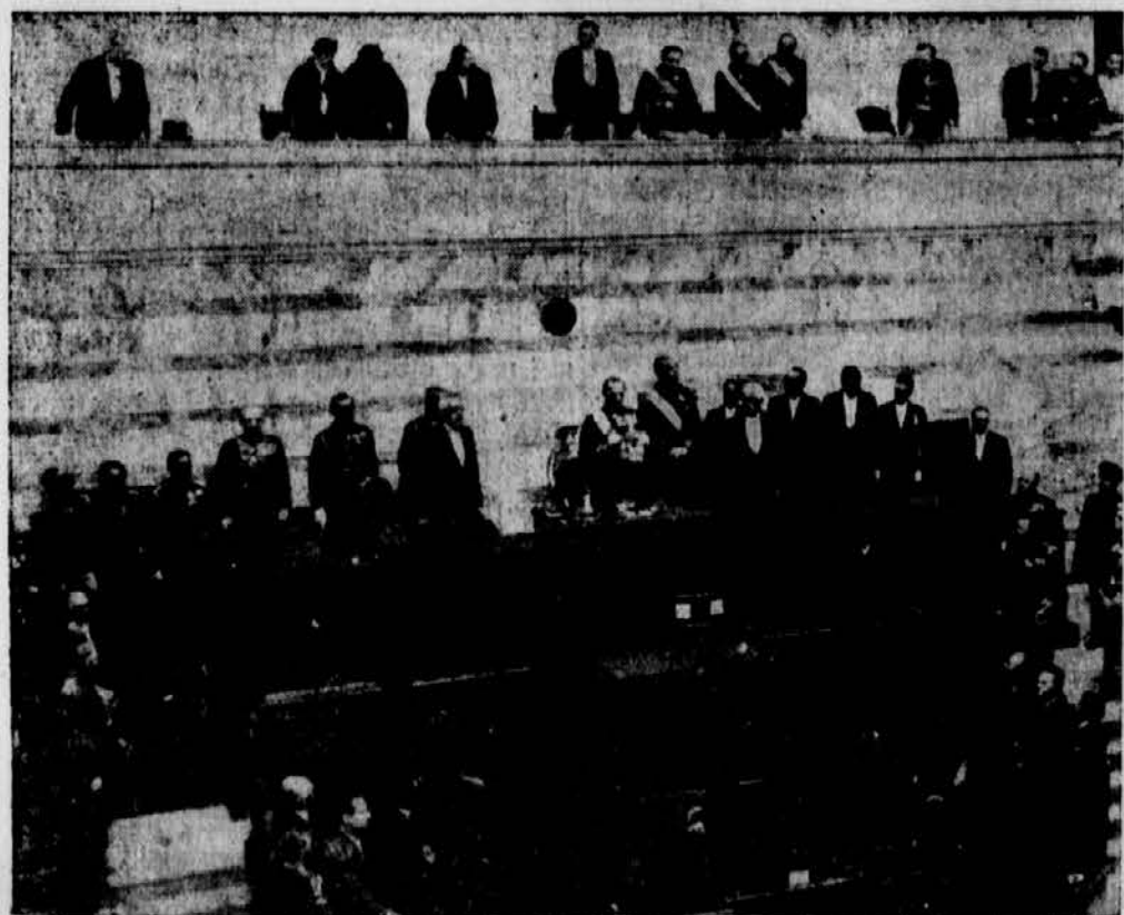
Das neugewählte griechische Parlament wurde mit einer Thronrede König Georgs eröffnet, die der Monarch selbst verlas. Man sieht auf unserem Bild den König während seiner Eröffnungsrede im griechischen Parlament.