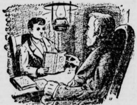
...mu je mojster na kratko razložil.

»Tako, tako,« je reval sedaj Godrnjač, »s trmo povračaš svojemu mojstru in dobrotniku. Da se mi kaj takga več ne drzneš! Vajenec mora znati tudi kaj potrpeti. To spada tudi k učenju. In sedaj ti hočem še nekaj povedati. Ti imaš dve glavni slabosti, to sta ponos in jeza. Pa zapomni si: Ponos in