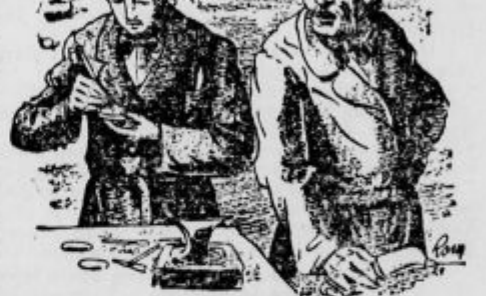
»Ti si domišljaj...«