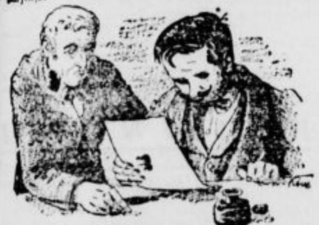
Sedaj je prebral Vetrnjak pisavo.

»To je krivica, goljufija, nezakonitost,« se je spiral Vetrnjak, tresoč se po vsem telesu od razburjenja.