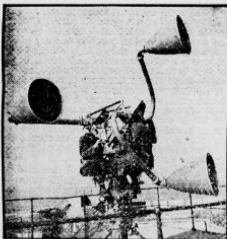
Slušna naprava italijanskega protiletalskega topništva