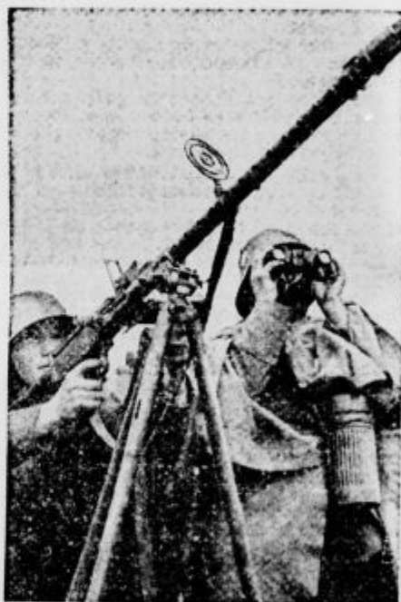
Nemška protiletalska strojnica