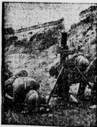
Nemški metalci bomb