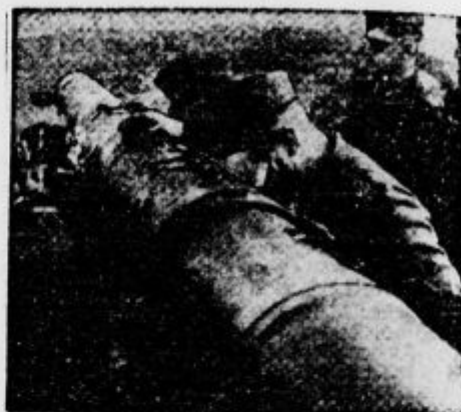
Vojaki pri napravah, ki napovedujejo bližanje letal

V 17. stoletju so poleg strelcev še vedno igrali čete s sulicami važno vlogo. Takrat so iznašli bajonet, ki je združil čete strelcev in suličarjev v eno skupino. Druga, navidezna iznajdba je imela še večje posledice: to so bile papirnate patrone. Dotlej je bilo treba namreč vedno prej vzeti smodnik iz mošnje za smodnik, ga izmeriti in stresti v cev. K temu je treba dodati še nov način izvežbanja čet v oddelkih, ki so streljali drug za drugim, tako da je njihovo streljanje sličilo streljanju s strojnimi.