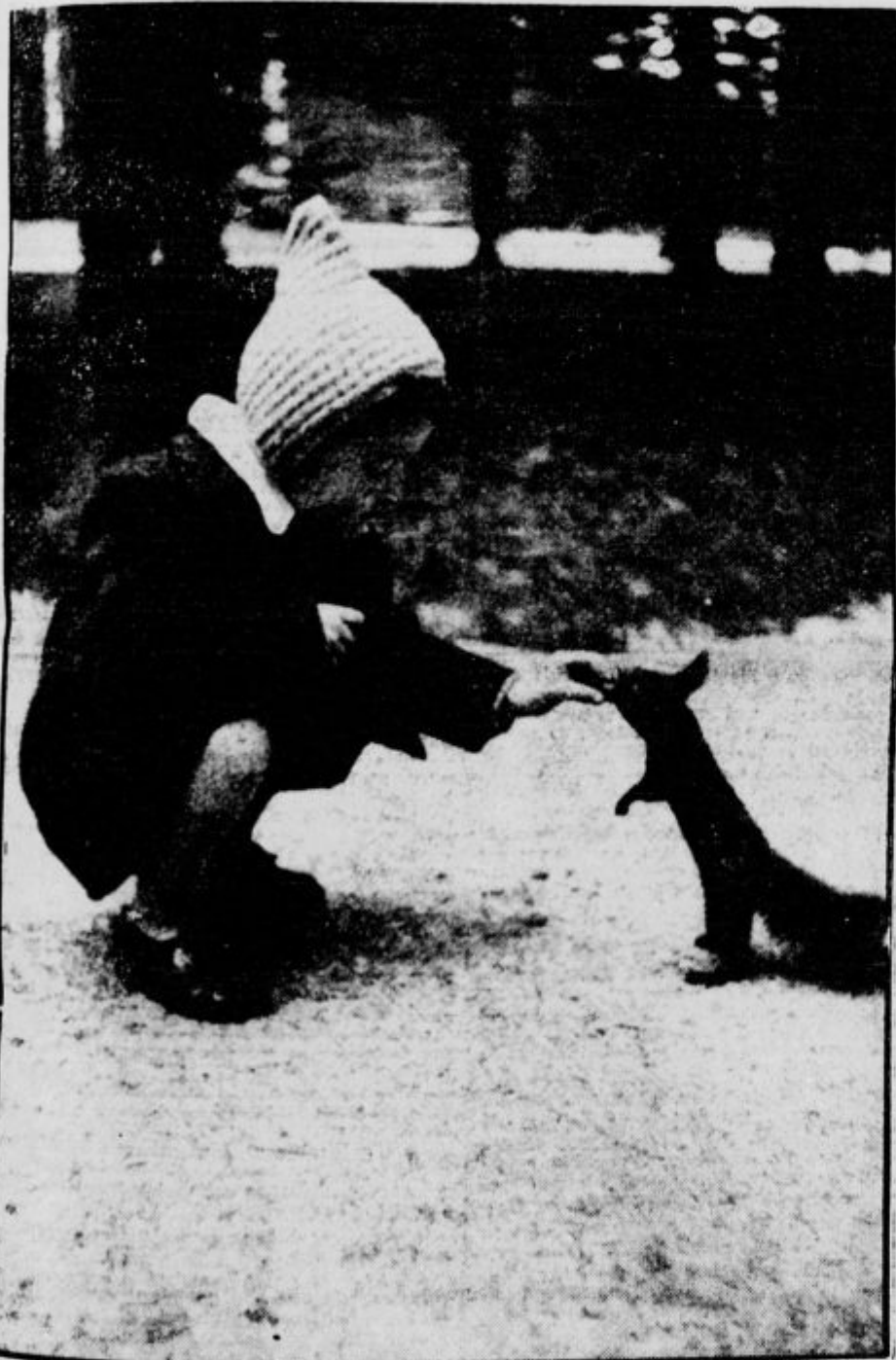
Dva prijatelja v pomladnem tivolskem parku

Zastopniki! Obiščite sleherno hišo v vašem kraju, kjer še nimajo »Domoljuba«, naj ga na novo naroče!